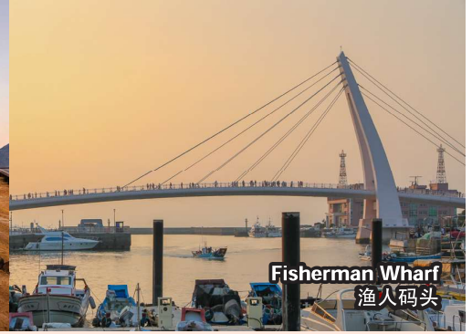
Fisherman Wharf 渔人码头