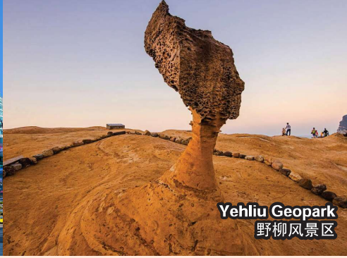
Yehliu Geopark 野柳风景区