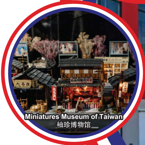
Miniatures Museum of Taiwan 袖珍博物馆