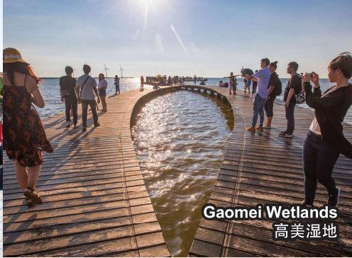
Gaomei Wetlands 高美湿地