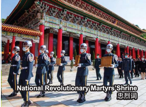
National Revolutionary Martyrs' Shrine 忠烈祠