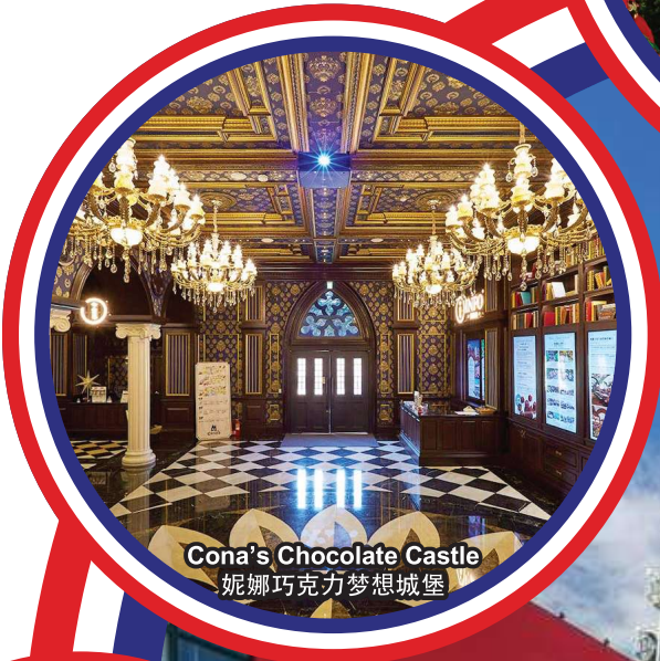
Cona's Chocolate Castle 妮娜巧克力梦想城堡