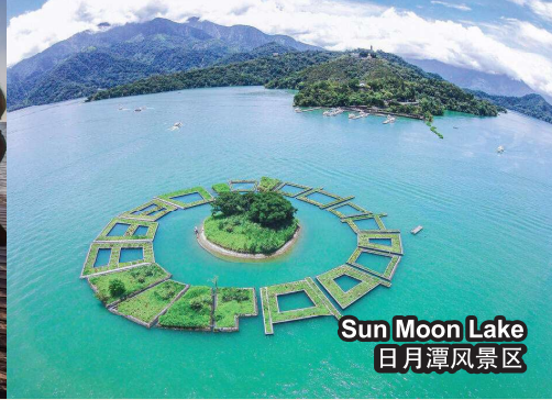
Sun Moon Lake 日月潭风景区