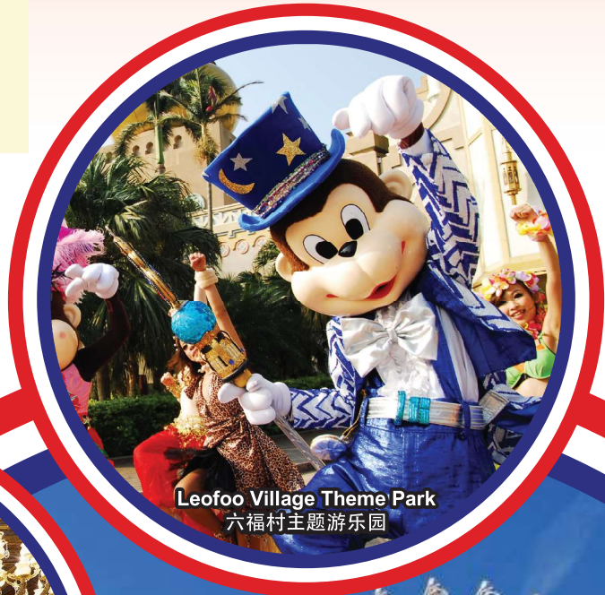
Lefoo Village Theme Park 六福村主题乐园