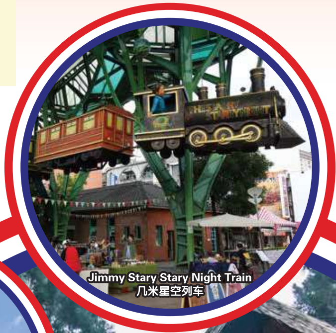
Jimmy Stary Stary Night Train 几米星空列车