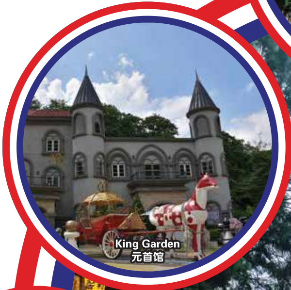
King Garden 元首馆