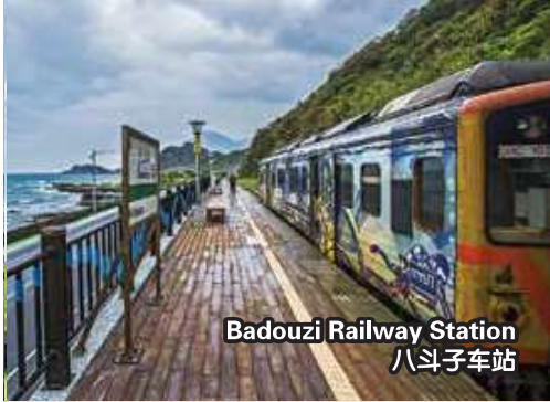
Badouzi Railway Station 八斗子车站