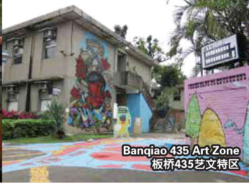
Banqiao 435 Art Zone 板桥435艺术特区