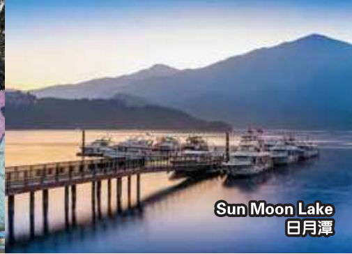
Sun Moon Lake 日月潭