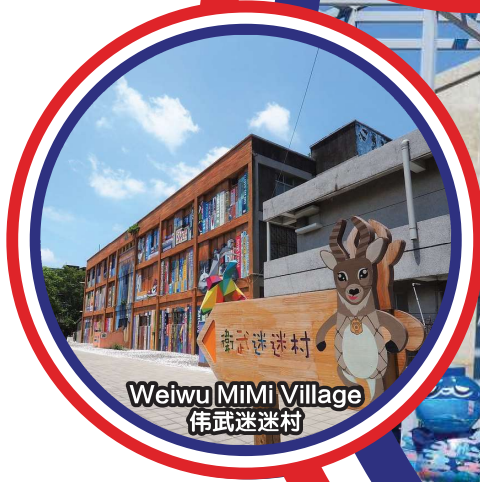
Weiwu MiMi Village 伟武迷迷村