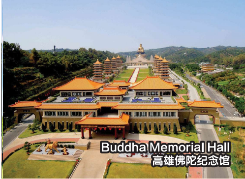
Buddha Memorial Hall 高雄佛陀纪念馆