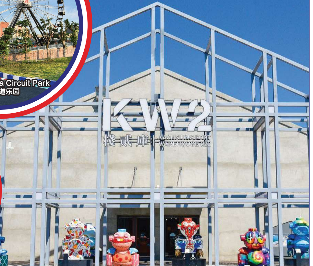
Kaoshiung Port Warehouse No.2 (KW2) KW2栈贰库

行程次序，以当地旅社安排为准。 Sequences of Itinerary are subject to local arrangement.