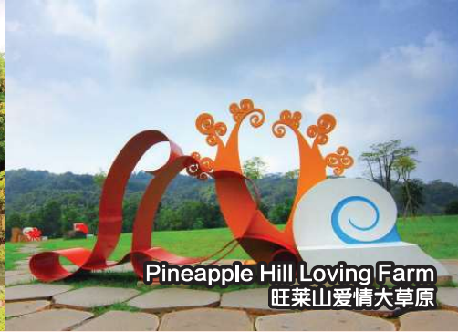
Pineapple Hill Loving Farm 旺莱山爱情大草原