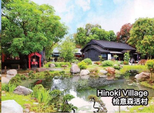
Hinoki Village 桧意森活村