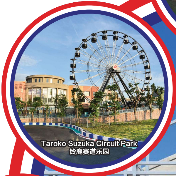
Taroko Suzuka Circuit Park 铃鹿赛道乐园