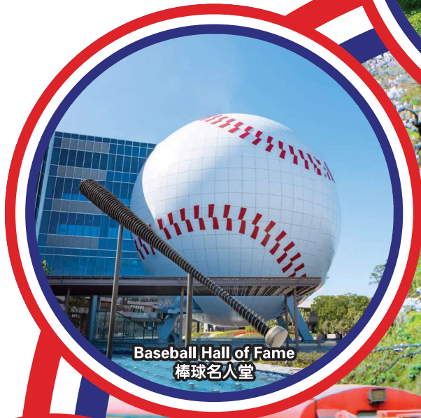
Baseball Hall of Fame 棒球名人堂