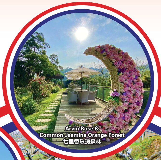
Arvin Rose & Common Jasmine Orange Forest 七里香玫瑰森林