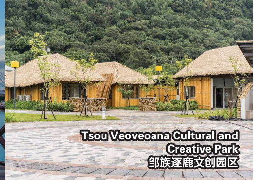
Tsou Veoveoana Cultural and Creative Park 邹族逐鹿文创园区