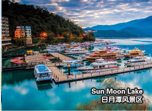
Sun Moon Lake 日月潭风景区