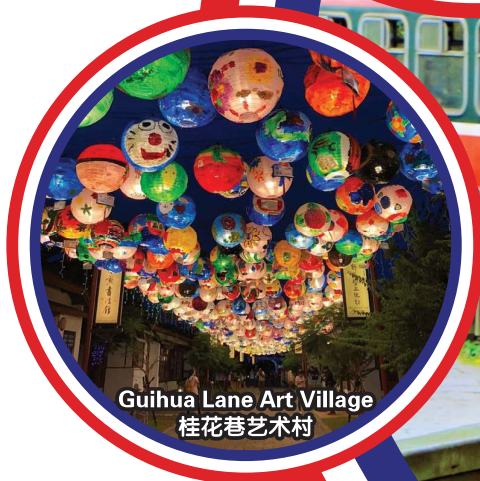
Guihua Lane Art Village 桂花巷艺术村