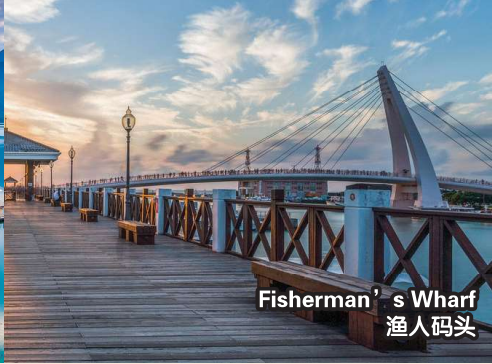
Fisherman's Wharf 渔人码头