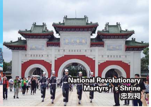
National Revolutionary Martyrs' s Shrine 忠烈祠