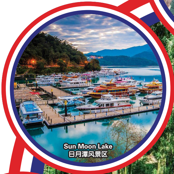
Sun Moon Lake 日月潭风景区