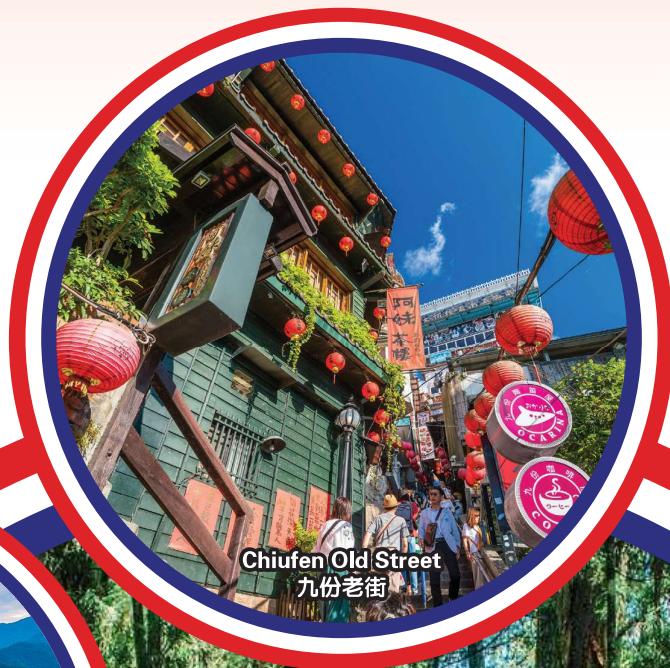
Chiufen Old Street 九份老街