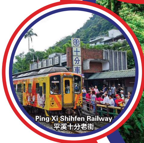
Ping Xi Shihfen Railway 平溪十分老街