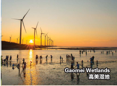
Gaomei Wetlands 高美湿地