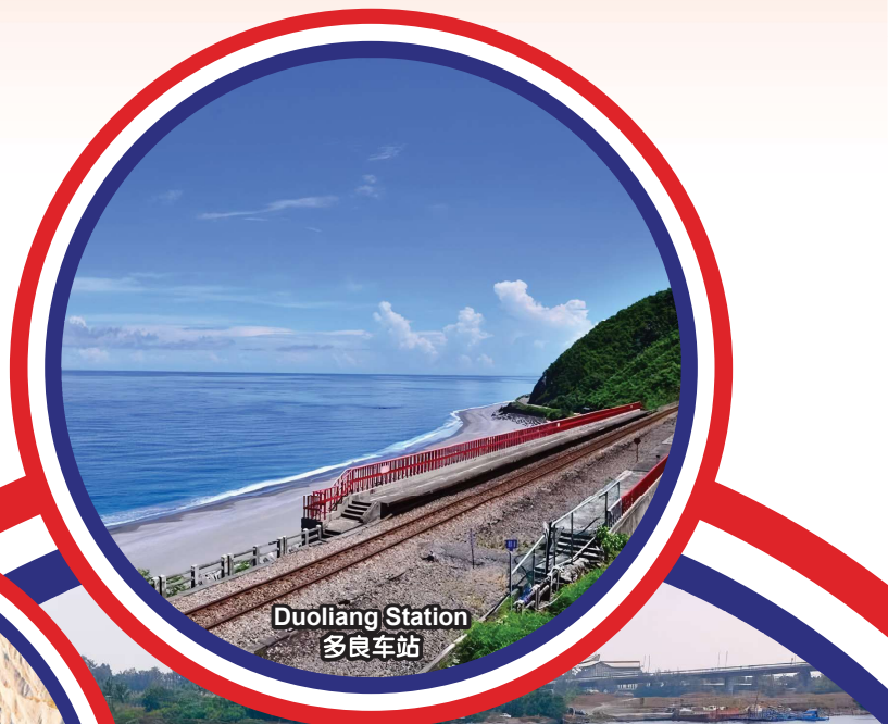
Duoliang Station 多良车站