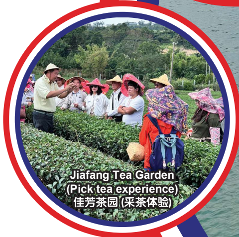
Jiafang Tea Garden (Pick tea experience) 佳芳茶园 (采茶体验)