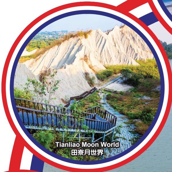
Tianliao Moon World 田寮月世界