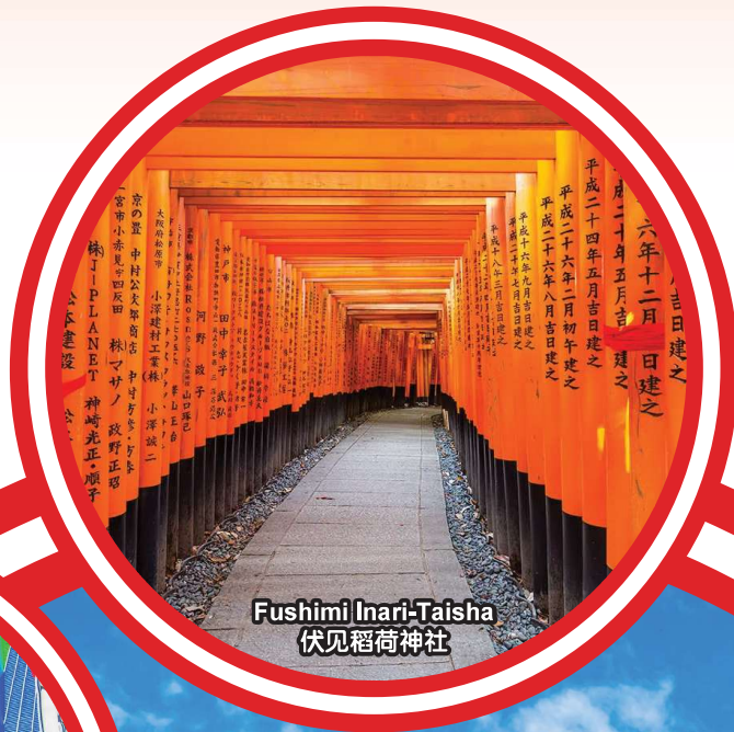
Fushimi Inari-Taisha 伏见稻荷神社