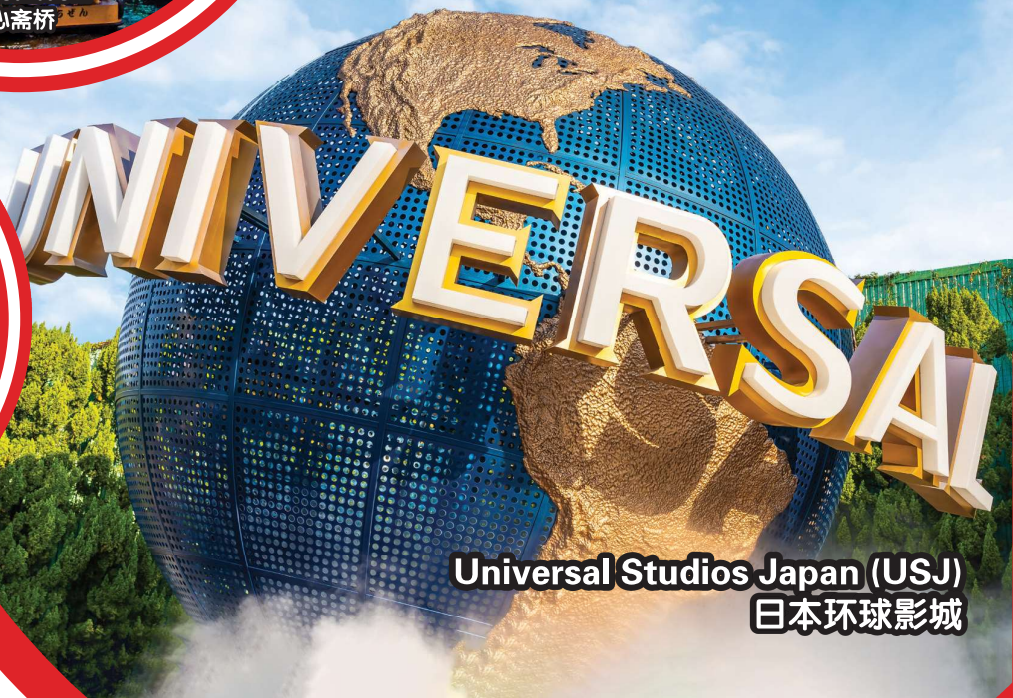
Universal Studios Japan (USJ) 日本环球影城

行程次序，以当地旅社安排为准。 Sequences of Itinerary are subject to local arrangement.