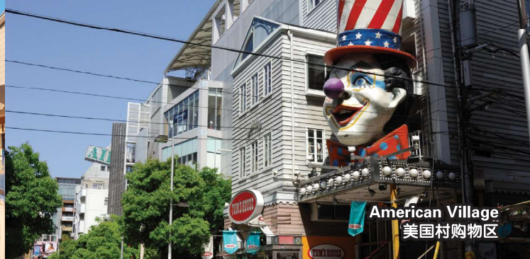
American Village 美国村购物区