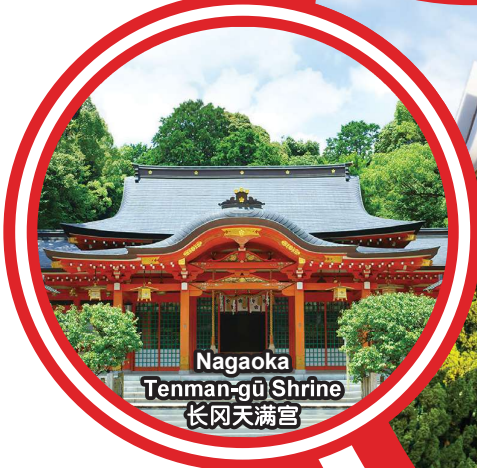
Nagaoka Tenman-gu Shrine 长冈天满宫