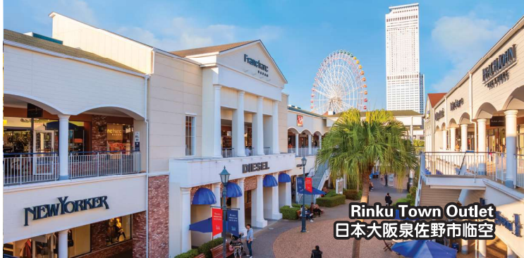
Rinku Town Outlet 日本大阪泉佐野市临空