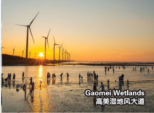
Gaomei Wetlands 高美湿地风大道