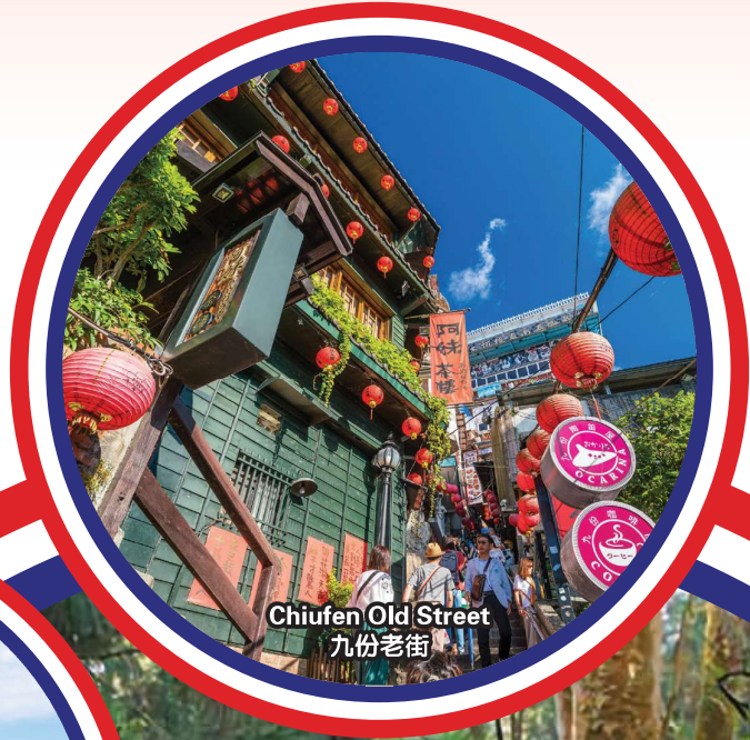
Chiufen Old Street 九份老街