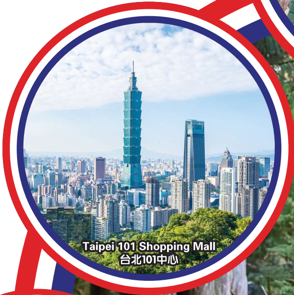
Taipei 101 Shopping Mall 台北101中心