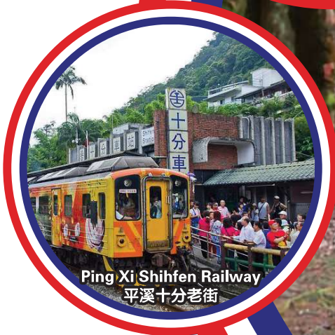
Ping Xi Shihfen Railway 平溪十分老街