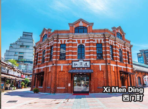
Xi Men Ding 西门町