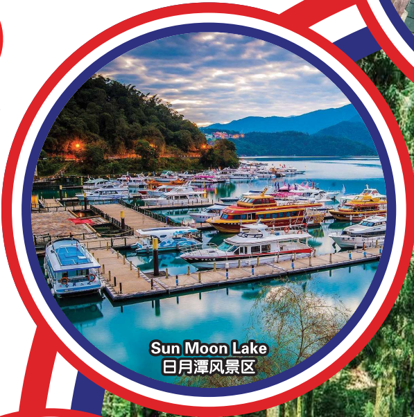
Sun Moon Lake 日月潭风景区