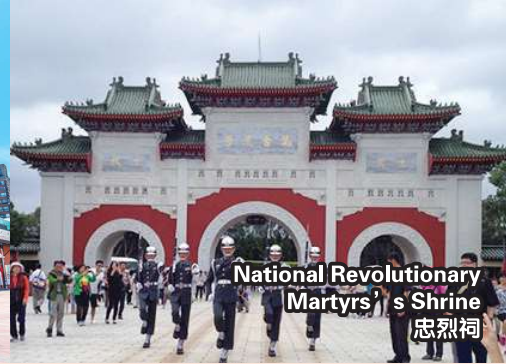
National Revolutionary Martyrs' s Shrine 忠烈祠