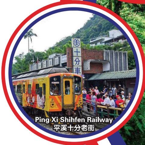
Ping Xi Shihfen Railway 平溪十分老街