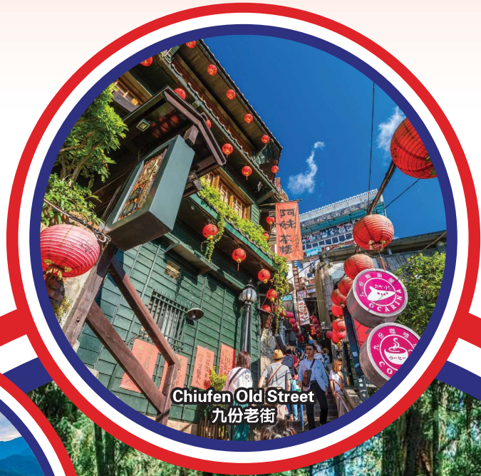
Chiufen Old Street 九份老街