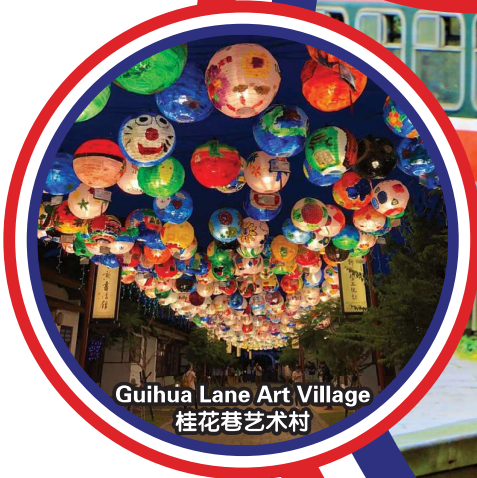
Guihua Lane Art Village 桂花巷艺术村