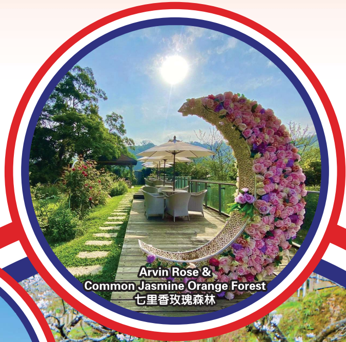
Arvin Rose & Common Jasmine Orange Forest 七里香玫瑰森林