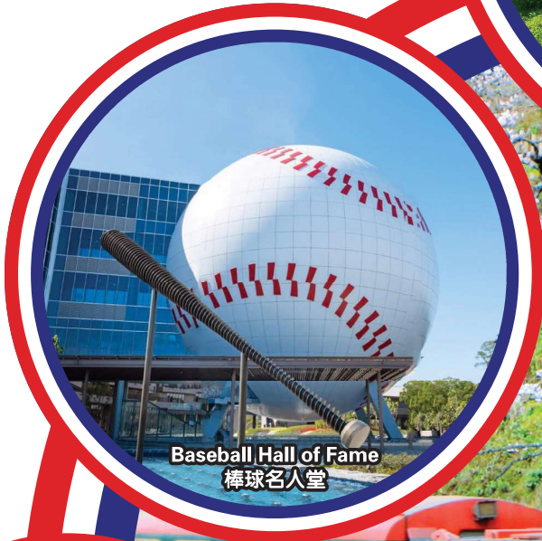
Baseball Hall of Fame 棒球名人堂