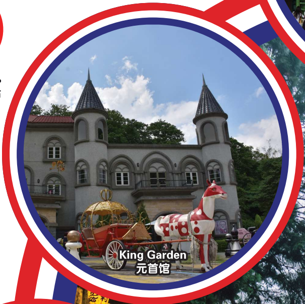
King Garden 元首馆