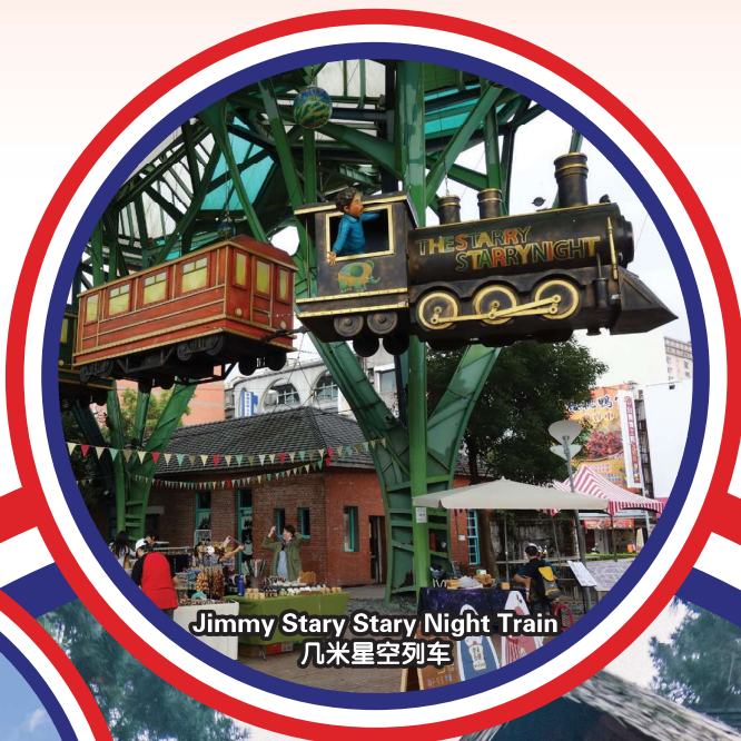
Jimmy Stary Stary Night Train 几米星空列车