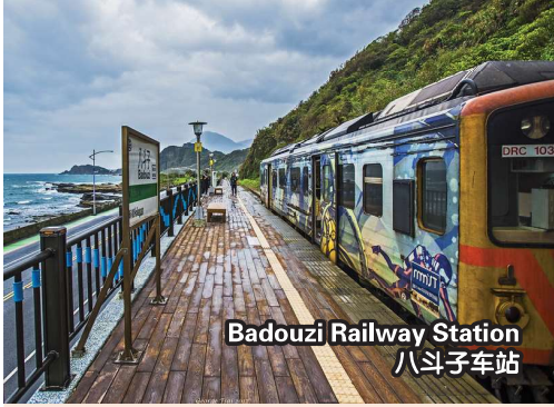
Badouzi Railway Station 八斗子车站