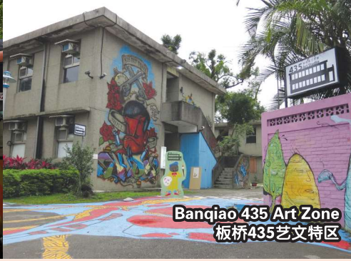
Banqiao 435 Art Zone 板桥435艺术特区