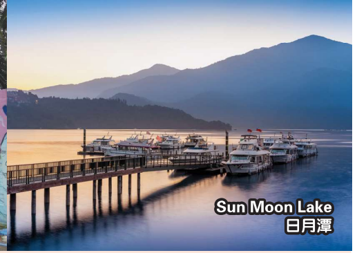
Sun Moon Lake 日月潭