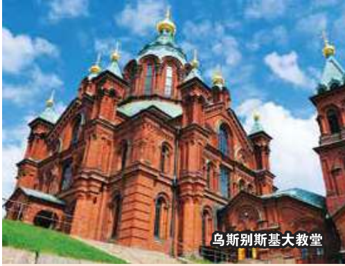
乌斯别斯基大教堂