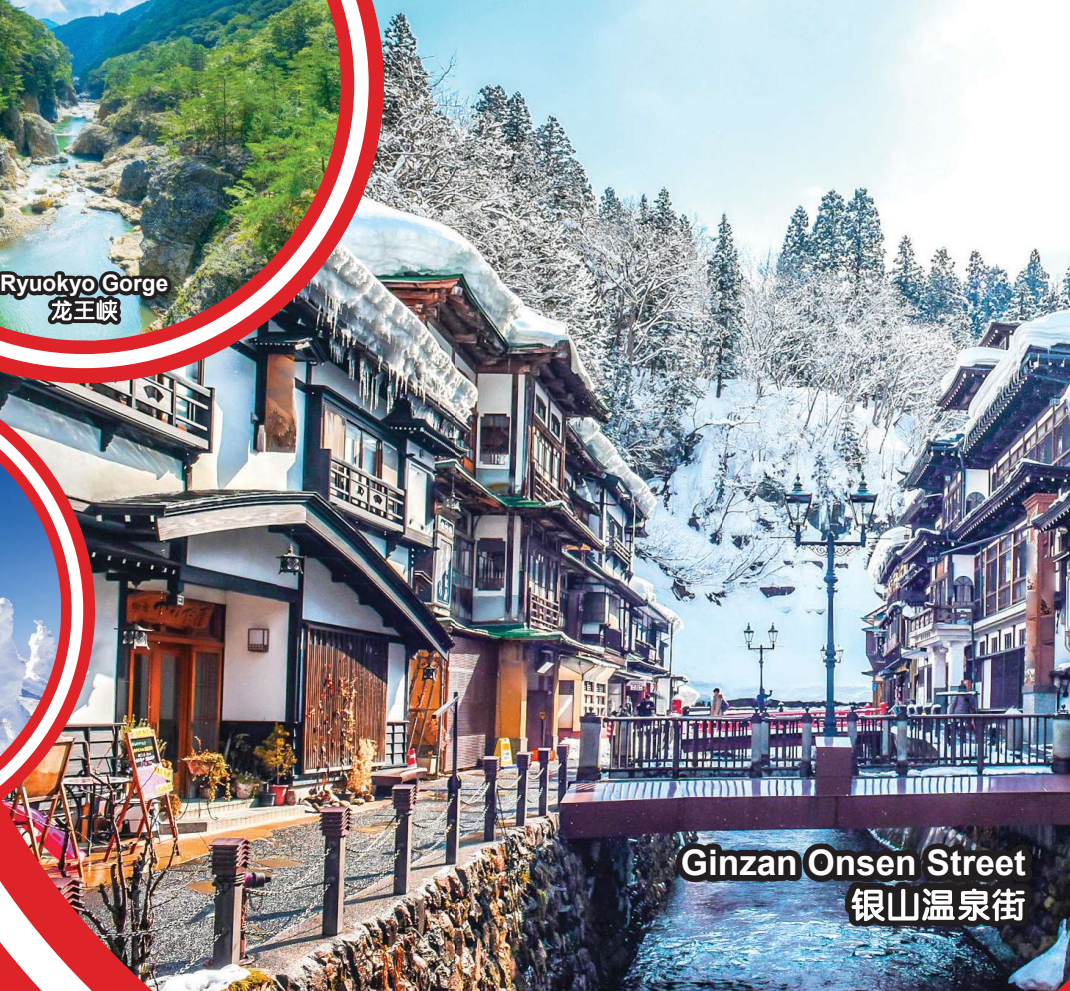
Ginzan Onsen Street 银山温泉街

行程次序，以当地旅社安排为准。 Sequences of Itinerary are subject to local arrangement.