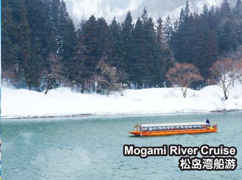
Mogami River Cruise 松岛湾船游