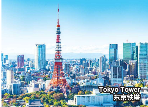
Tokyo Tower 东京铁塔