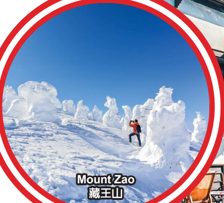
Mount Zao 藏王山