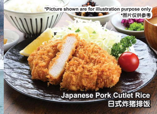
Japanese Pork Cutlet Rice 日式炸猪排饭

*Picture shown are for illustration purpose only *图片仅供参考