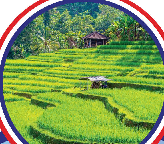
Jatiluwih Paddy Field 加德路易水稻梯田