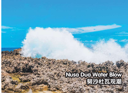
Nusa Dua Water Blow 努沙杜瓦观潮