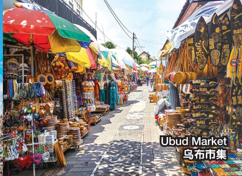
Ubud Market 乌布市集