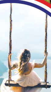
Desa Swing Desa秋千