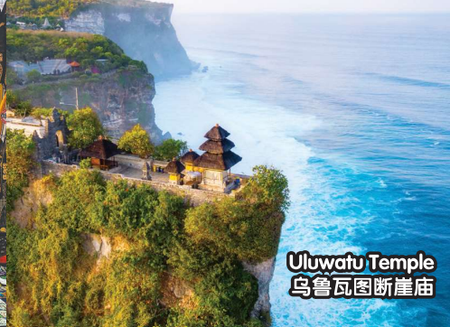
Uluwatu Temple 乌鲁瓦图断崖庙