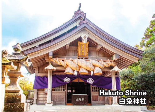
Hakuto Shrine 白兔神社