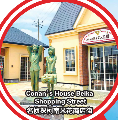
Conan's House Beika Shopping Street 名侦探柯南米花商店街