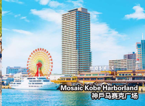
Mosaic Kobe Harborland 神戸马赛克广场