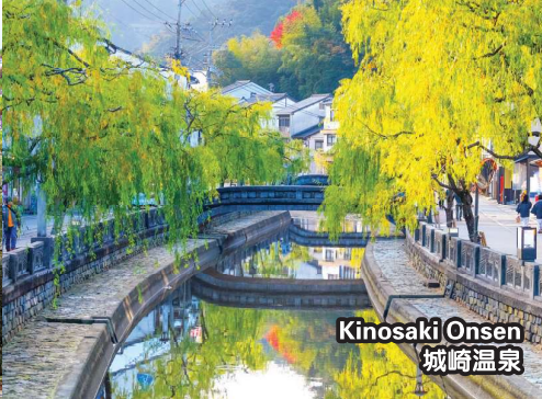
Kinosaki Onsen 城崎温泉