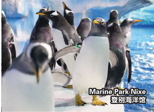
Marine Park Nixe 登别海洋馆