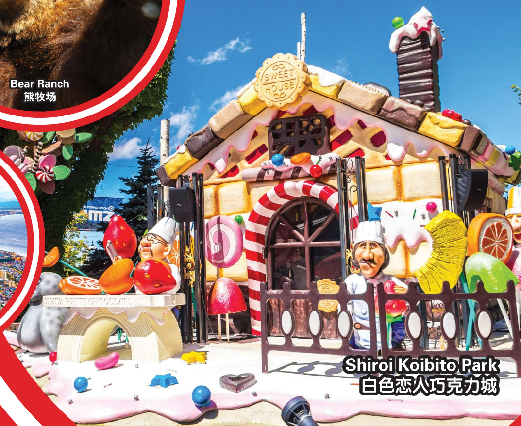
Shiroi Koibito Park 白色恋人巧克力城

行程次序，以当地旅社安排为准。 Sequences of Itinerary are subject to local arrangement.