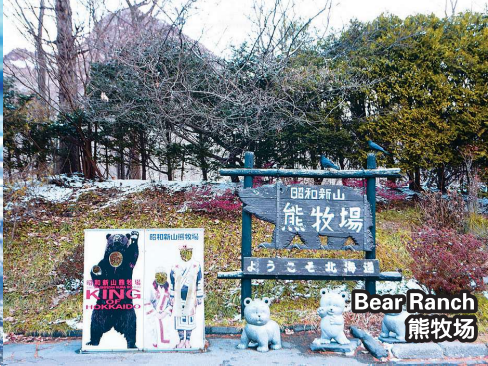
Bear Ranch 熊牧场