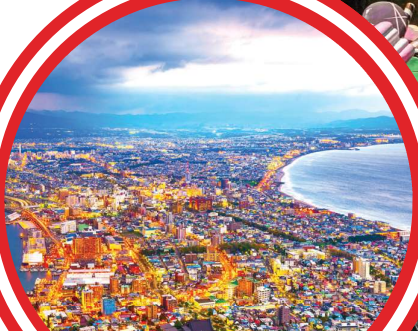
Hakodate Night View 函馆夜景