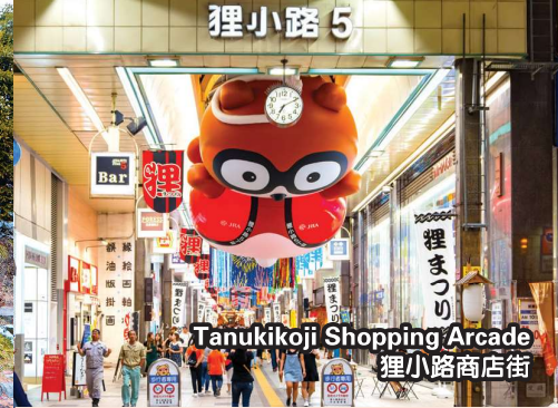
Tanukikoji Shopping Arcade 狸小路商店街