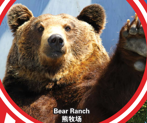
Bear Ranch 熊牧场