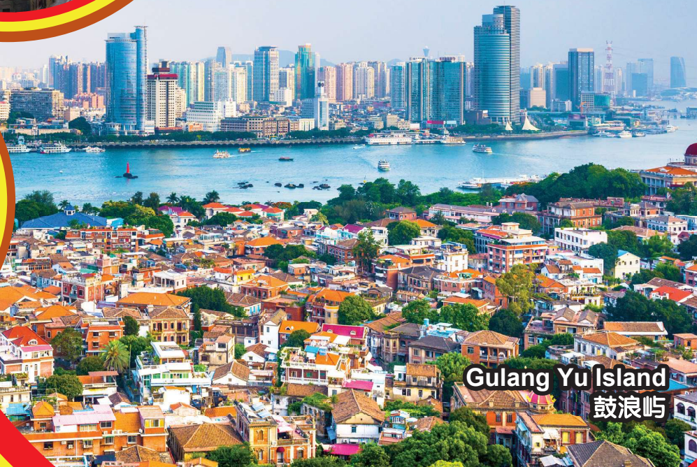
Gulang Yu Island 鼓浪屿

行程次序, 以当地旅社安排为准。 Sequences of Itinerary are subject to local arrangement.