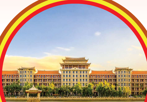
Jimei School Village 集美学村

丰顺维纳斯温泉酒店温泉泡汤, 请自备泳衣 Enjoy Hot Spring in Fengshun Venus International Hot Spring Hotel, please prepare own swimsuits and swim cap.