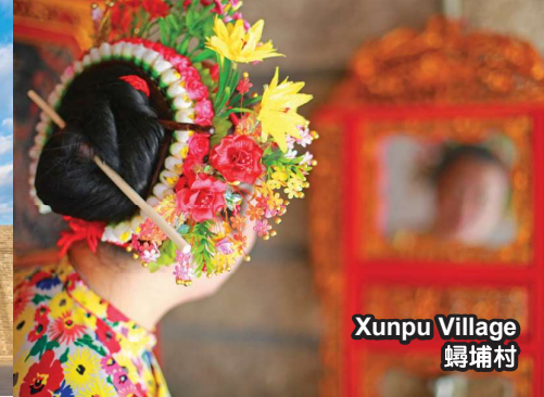
Xunpu Village 埭埔村