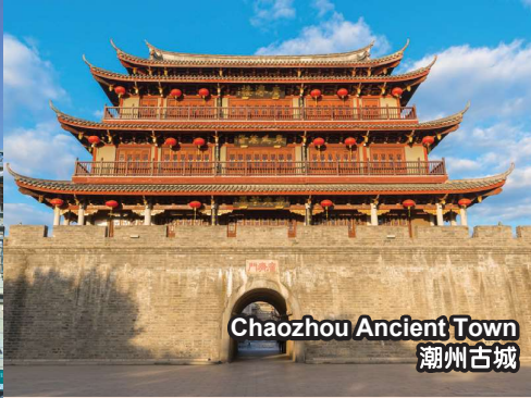
Chaozhou Ancient Town 潮州古城