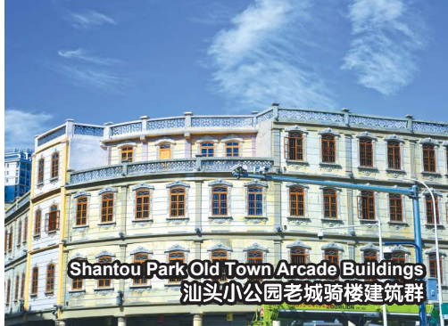
Shantou Park Old Town Arcade Buildings 汕头小公园老城骑楼建筑群