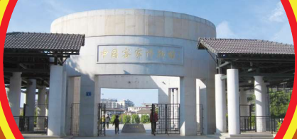
Hakka Museum 客家博物馆