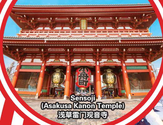
Sensoji (Asakusa Kanon Temple) 浅草雷门观音寺