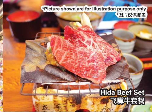
Hida Beef Set 飞驒牛套餐

*Picture shown are for illustration purpose only *图片仅供参考