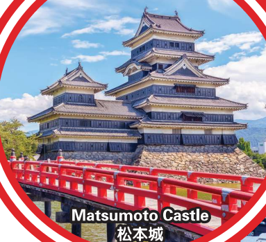
Matsumoto Castle 松本城