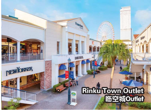
Rinku Town Outlet 临空城Outlet