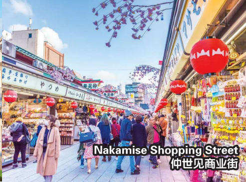
Nakamise Shopping Street 仲世见商业街