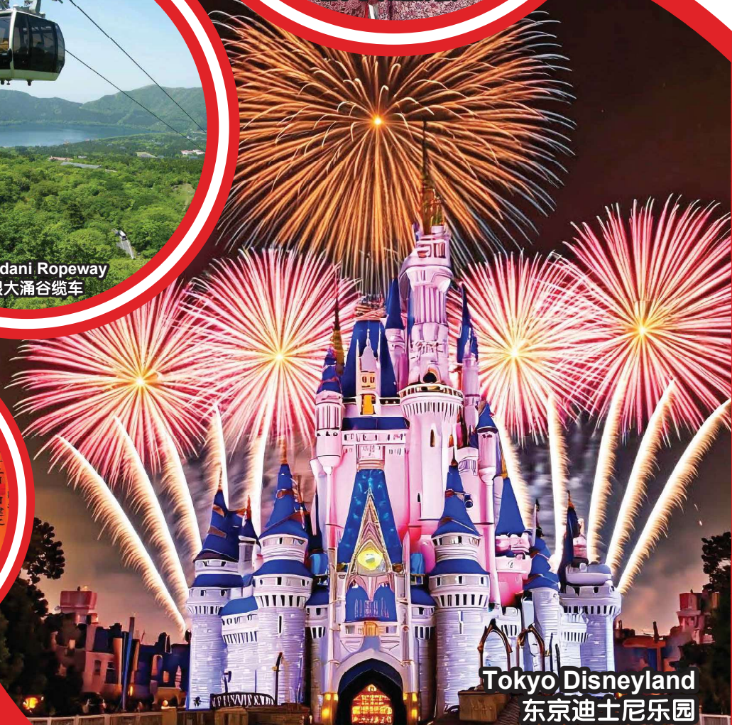
Tokyo Disneyland 东京迪士尼乐园

行程次序，以当地旅社安排为准。 Sequences of Itinerary are subject to local arrangement.