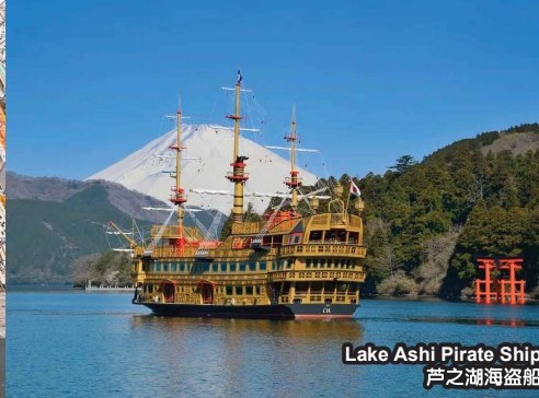
Lake Ashi Pirate Ship 芦之湖海盗船