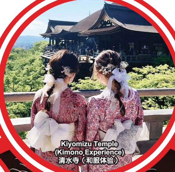
Kiyomizu Temple (Kimono Experience) 清水寺 (和服体验)