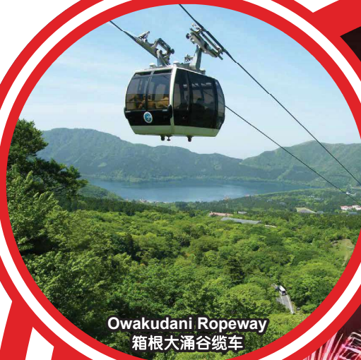
Owakudani Ropeway 箱根大涌谷缆车