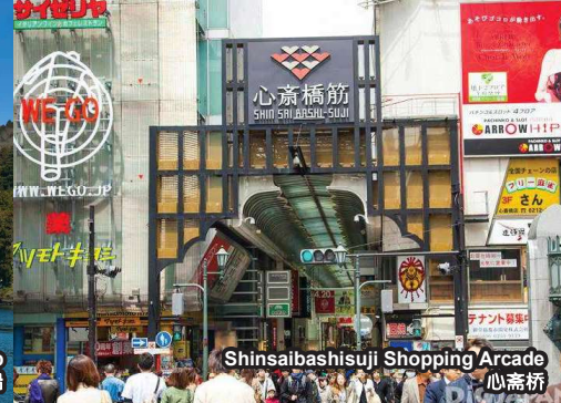
Shinsaibashisuji Shopping Arcade 心斋桥