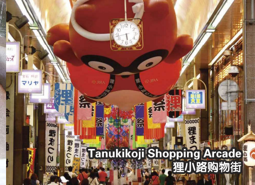
Tanukikoji Shopping Arcade 狸小路购物街