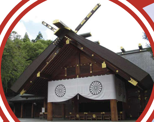
Hokkaido Shrine 北海道神宫