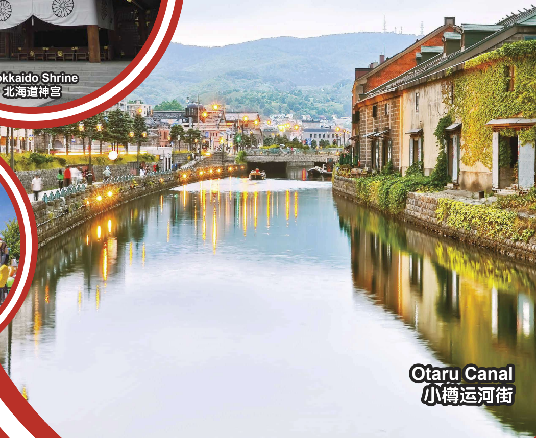
Otaru Canal 小樽运河街