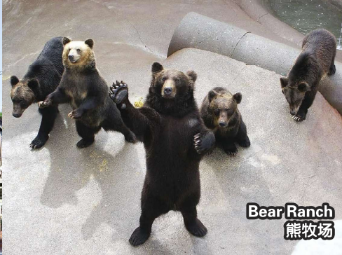
Bear Ranch 熊牧场