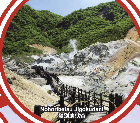
Noboribetsu Jigokudani 登别地狱谷