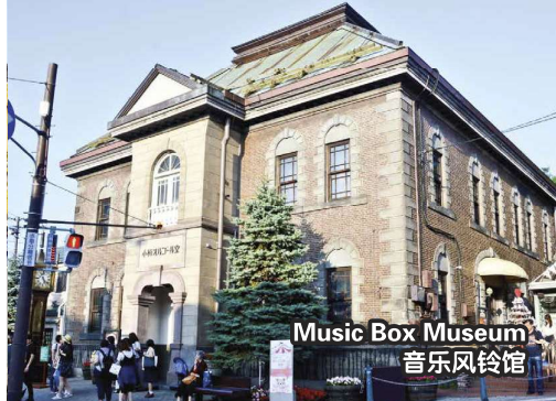
Music Box Museum 音乐风铃馆