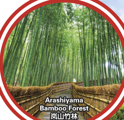
Arashiyama Bamboo Forest 岚山竹林