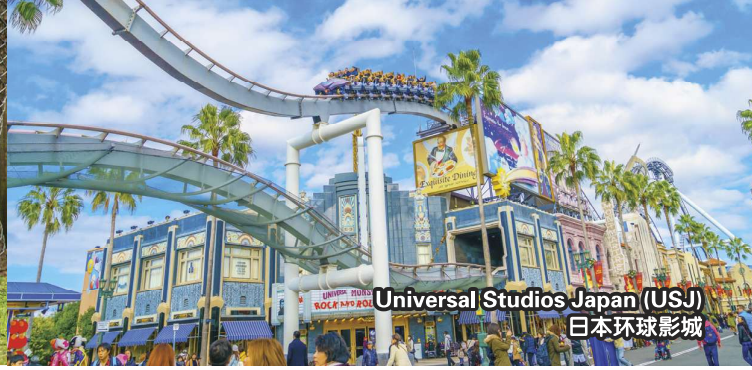
Universal Studios Japan (USJ) 日本环球影城