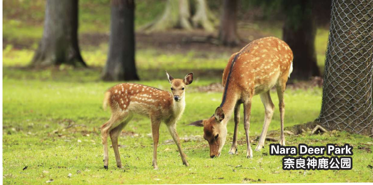
Nara Deer Park 奈良神鹿公园