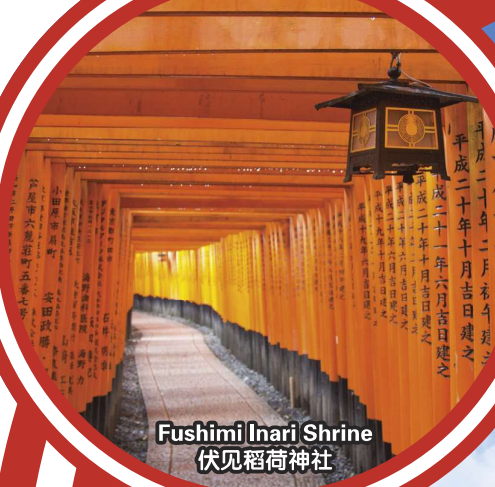
Fushimi Inari Shrine 伏见稻荷神社