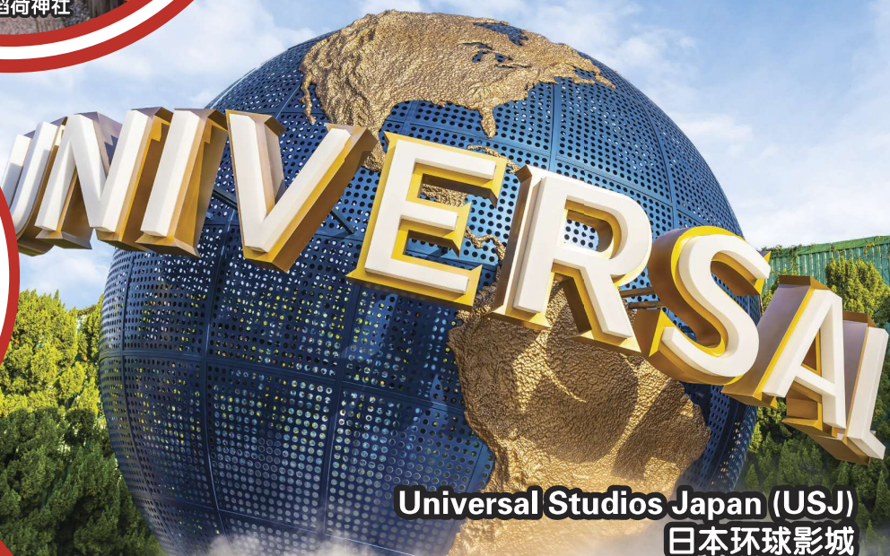
Universal Studios Japan (USJ) 日本环球影城