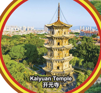
Kaiyuan Temple 开元寺