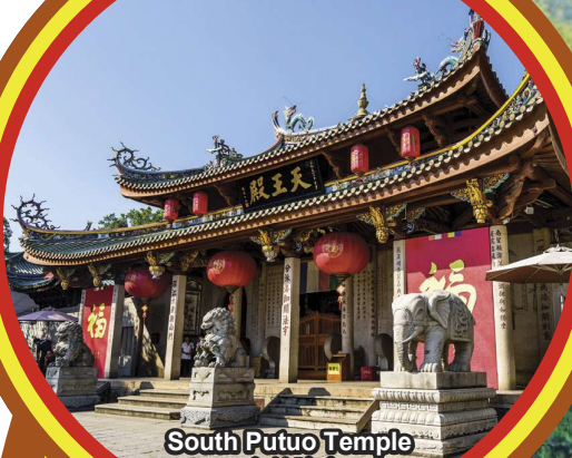
South Putuo Temple 南普陀寺