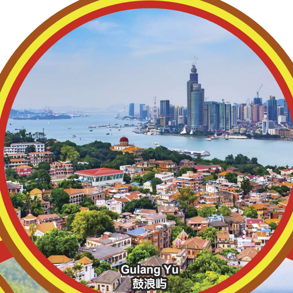
Gulang Yu 鼓浪屿