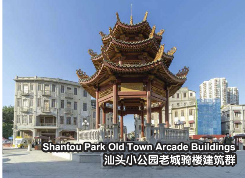
Shantou Park Old Town Arcade Buildings 汕头小公园老城骑楼建筑群