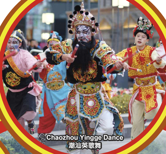
Chaozhou Yingge Dance 潮汕英歌舞