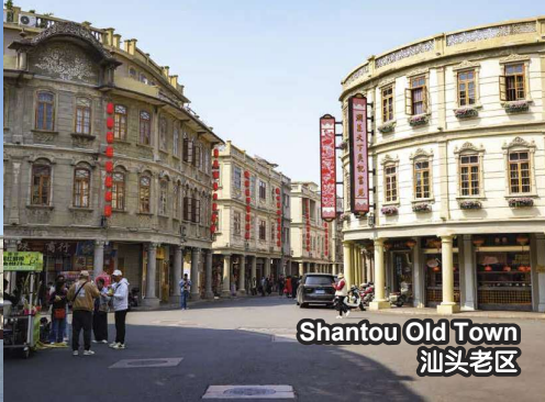
Shantou Old Town 汕头老区