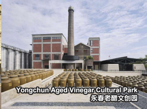
Yongchun/Aged Vinegar Cultural Park 永春老醋文创园