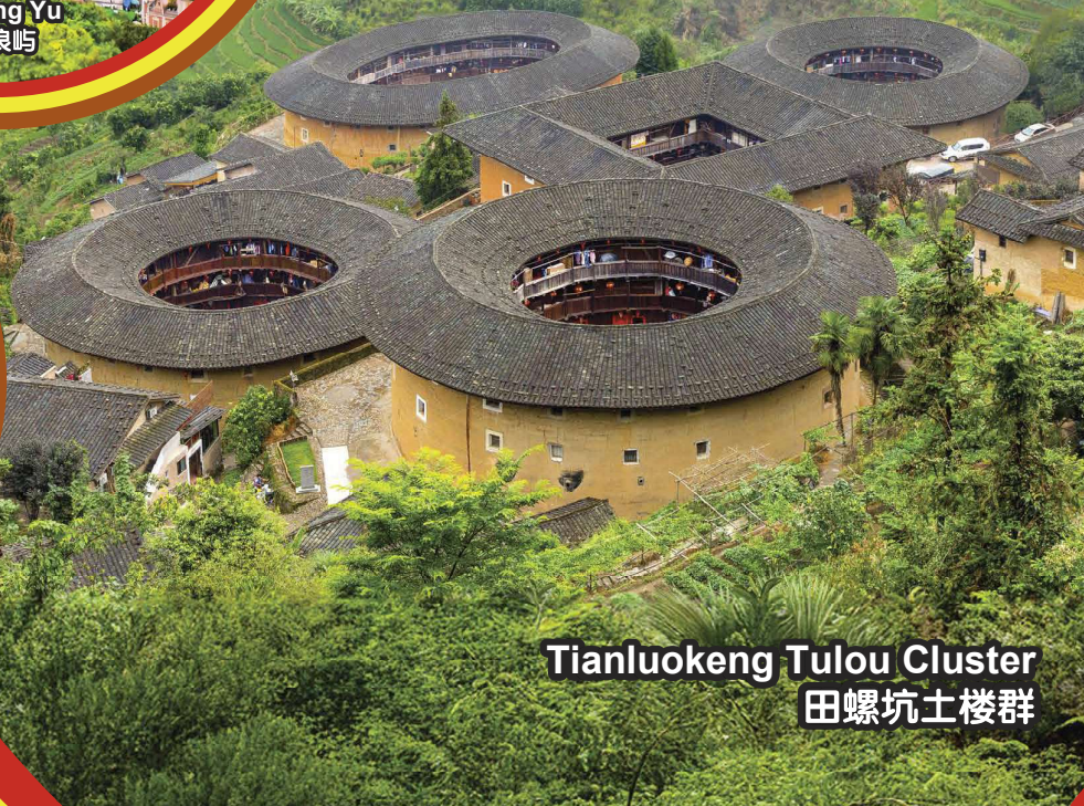
Tianluokeng Tulou Cluster 田螺坑土楼群

行程次序，以當地旅社安排為準。 Sequences of Itinerary are subject to local arrangement.