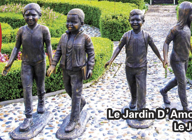
Le Jardin D'Amour Flower Garden Le Jardin D'Amour花园

行程次序, 以當地旅社安排為準。 Sequences of Itinerary are subject to local arrangement.