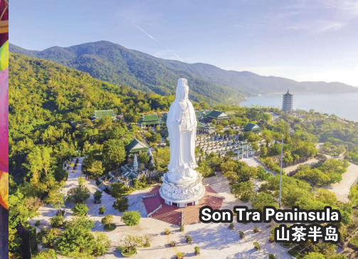
Son Tra Peninsula 山茶半岛