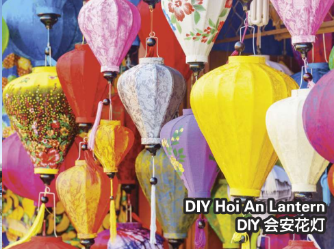
DIY Hoi An Lantern DIY 会安花灯