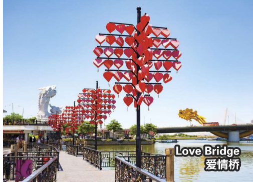
Love Bridge 爱情桥