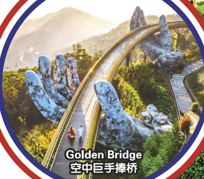
Golden Bridge 空中巨手捧桥