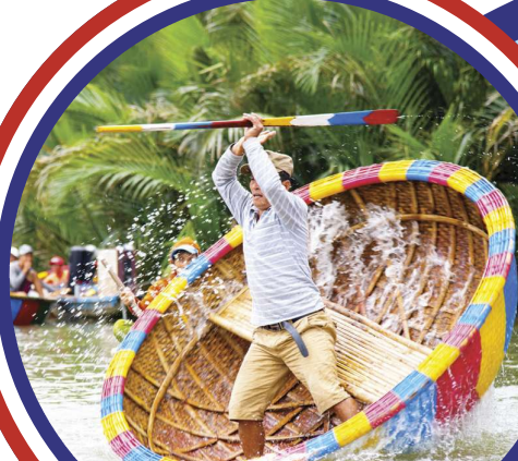
Cam Thanh Coconut Village Cam Thanh 椰子村