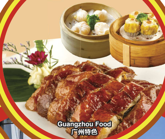
Guangzhou Food 广州特色