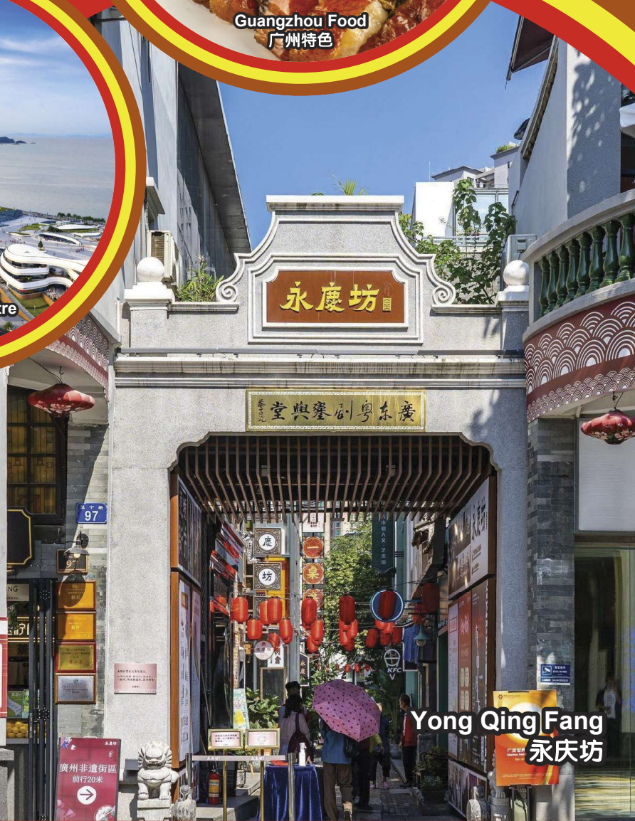
Yong Qing Fang 永庆坊

行程次序，以当地旅社安排为准。 Sequences of Itinerary are subject to local arrangement.