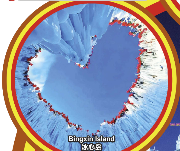
Bingxin Island 冰心岛