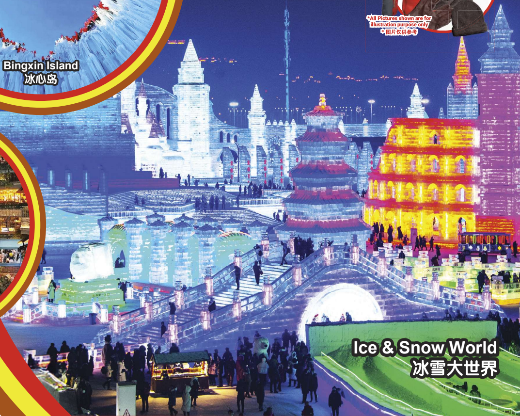
Ice & Snow World 冰雪大世界

行程次序，以当地旅社安排为准。 Sequences of Itinerary are subject to local arrangement.