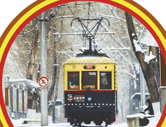
Changchun Retro Tram 长春号复古电车