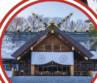
Hokkaido Shrine 北海道神宫