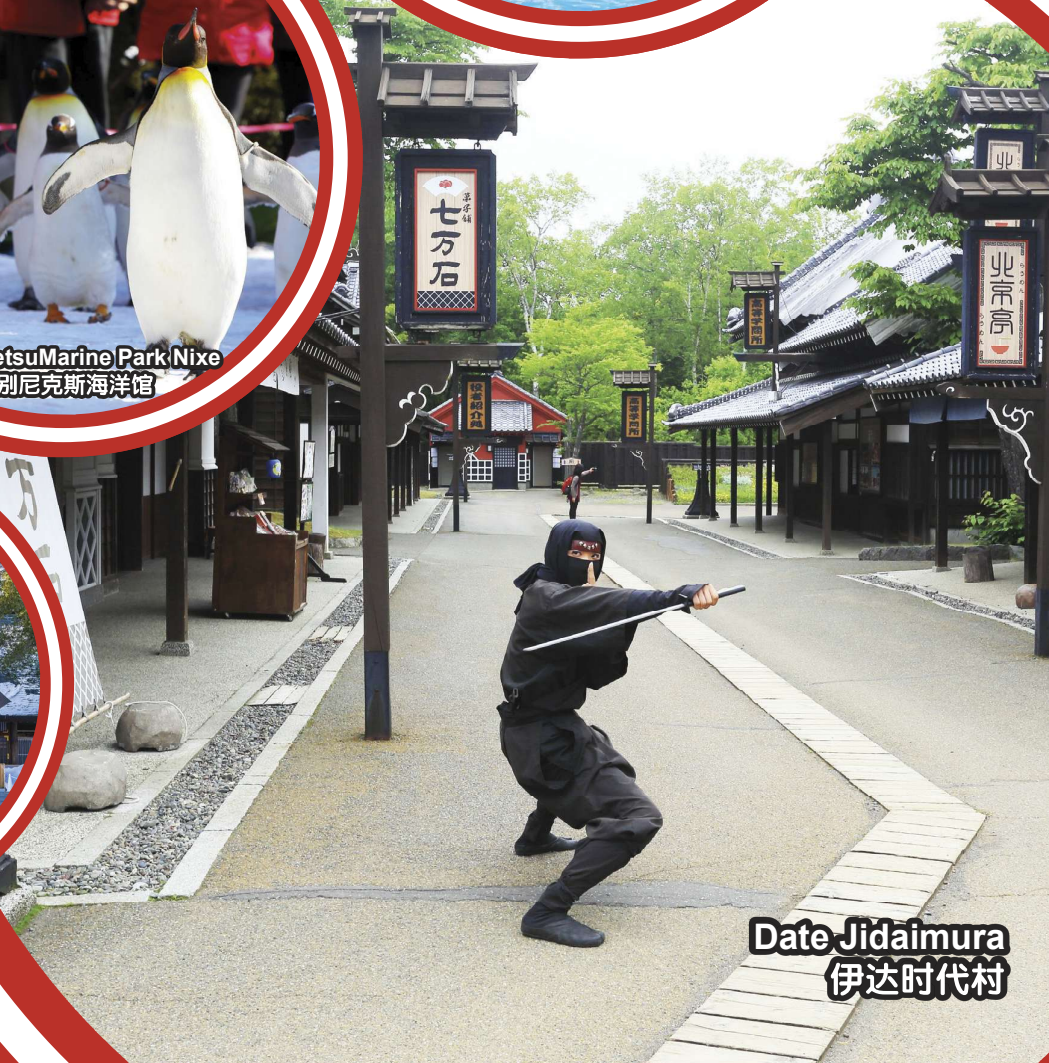
Date Jidaimura 伊达时代村

行程次序，以當地旅社安排為準。 Sequences of Itinerary are subject to local arrangement.