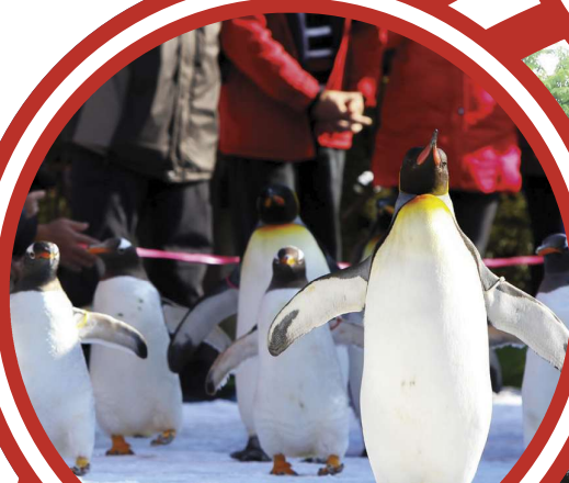
Noboribetsu Marine Park Nixe 登別尼克斯海洋馆