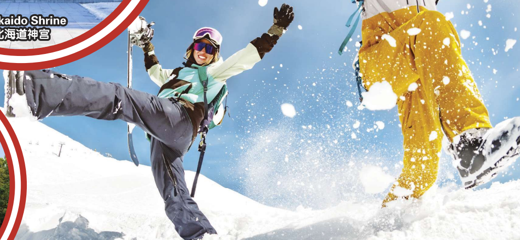
Sapporo Kokusai Ski 札幌国际滑雪场

行程次序，以當地旅社安排為準。 Sequences of Itinerary are subject to local arrangement.