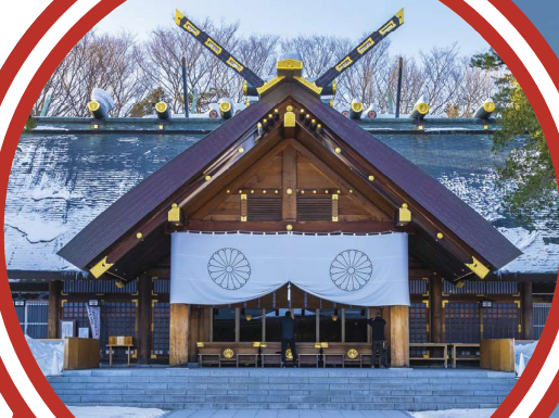
Hokkaido Shrine 北海道神宫