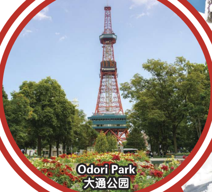
Odori Park 大通公园