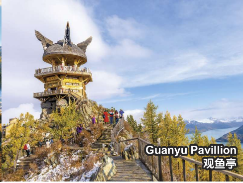
Guanyu Pavilion 观鱼亭