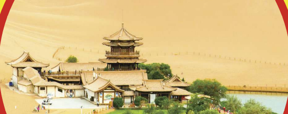
Mingsha Mountain and Crescent Moon Spring 鸣沙山月牙泉