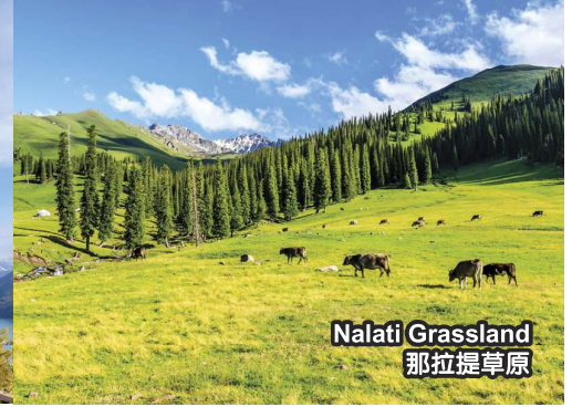
Nalati Grassland 那拉提草原