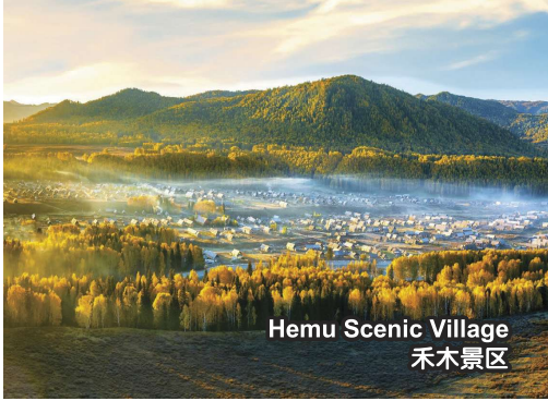
Hemu Scenic Village 禾木景区