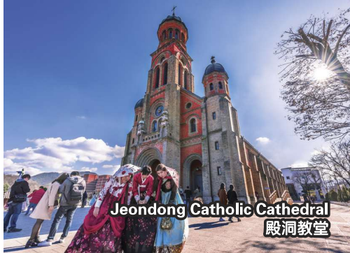
Jeondong Catholic Cathedral 殿洞教堂