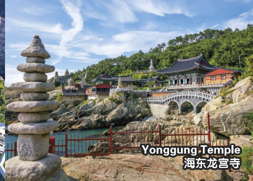
Yonggung Temple 海东龙宫寺