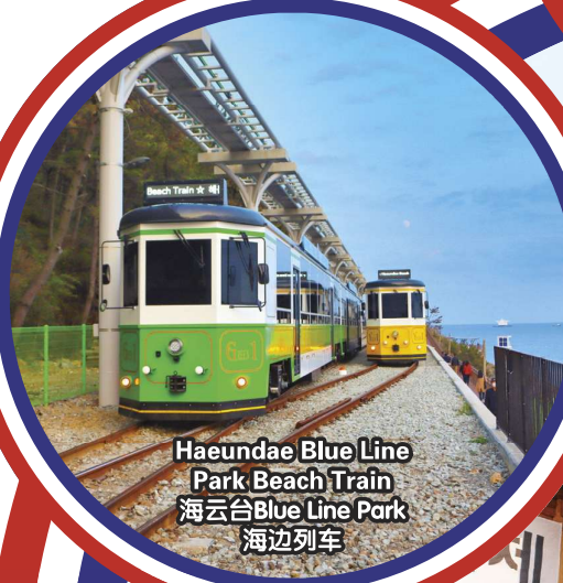
Haeundae Blue Line Park Beach Train 海云台Blue Line Park 海边列车