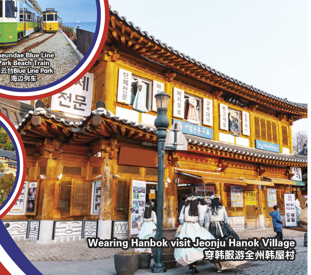
Wearing Hanbok visit Jeonju Hanok Village 穿韩服游全州韩屋村

行程次序，以当地旅社安排为准。 Sequences of Itinerary are subject to local arrangement.