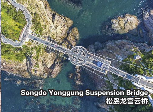
Songdo Yonggung Suspension Bridge 松岛龙宫云桥