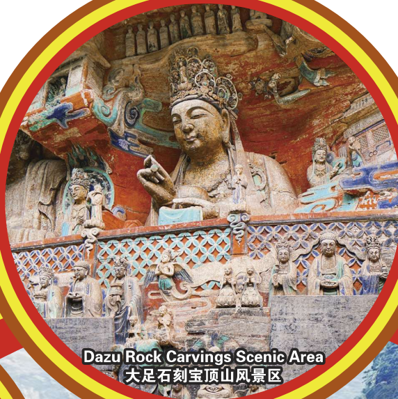
Dazu Rock Carvings Scenic Area 大足石刻宝顶山风景区