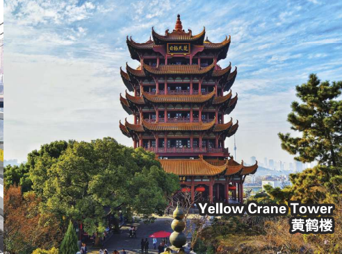
Yellow Crane Tower 黄鹤楼