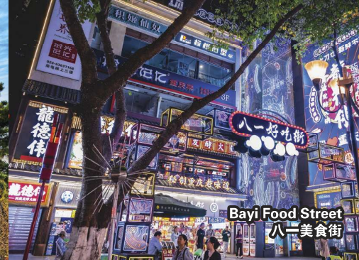
Bayi Food Street 八一美食街