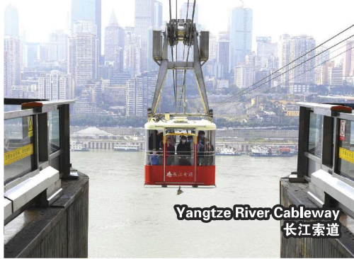
Yangtze River Cableway 长江索道