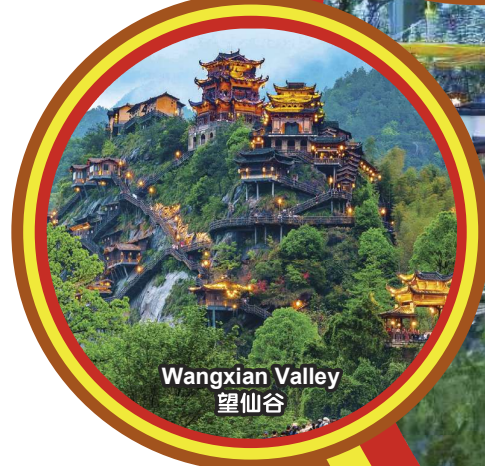
Wangxian Valley 望仙谷