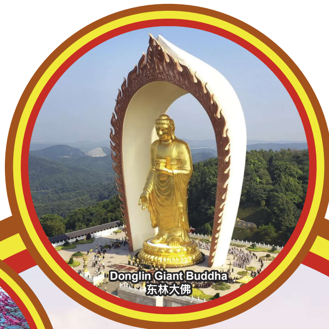
Donglin Giant Buddha 东林大佛