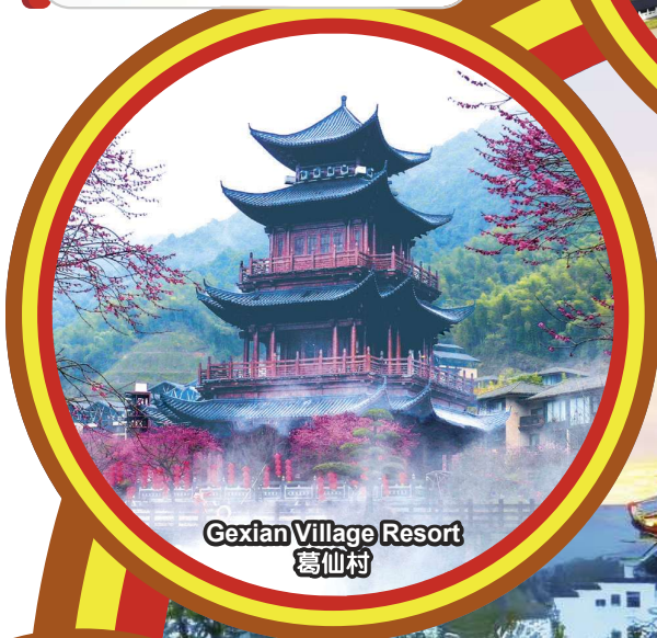
Gexian Village Resort 葛仙村