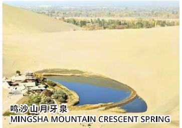
鸣沙山月牙泉 MINGSHA MOUNTAIN CRESCENT SPRING