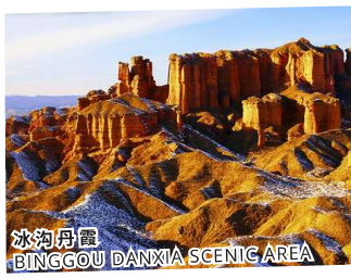
冰沟丹霞 BINGGOU DANXIA SCENIC AREA