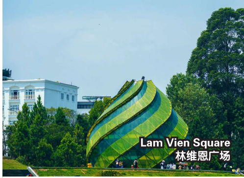
Lam Vien Square 林维恩广场