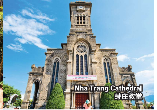
Nha Trang Cathedral 芽庄教堂