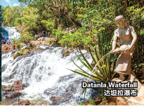
Datanla Waterfall 达坦拉瀑布