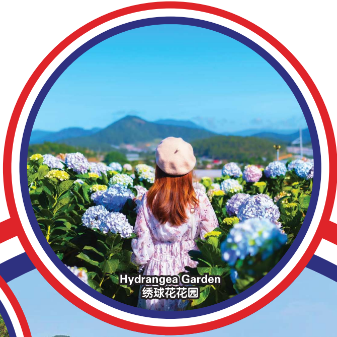
Hydrangea Garden 绣球花花园