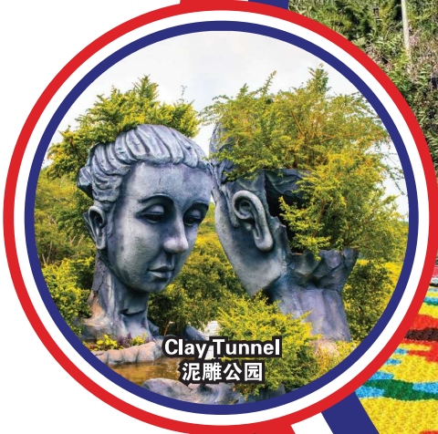
Clay Tunnel 泥雕公园