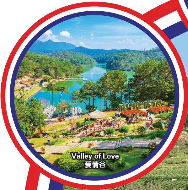
Valley of Love 爱情谷