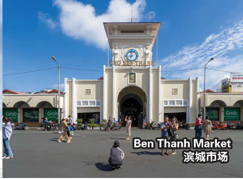
Ben Thanh Market 滨城市场