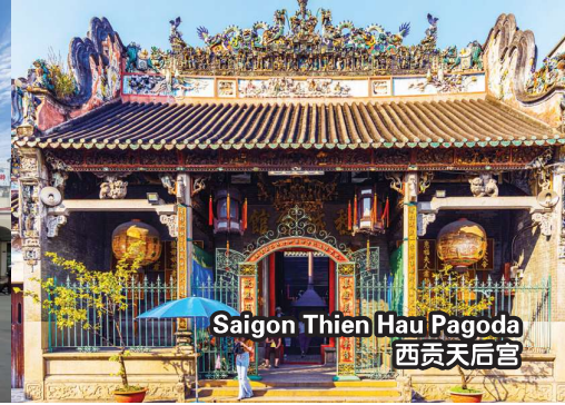
Saigon Thien Hau Pagoda 西贡天后宫