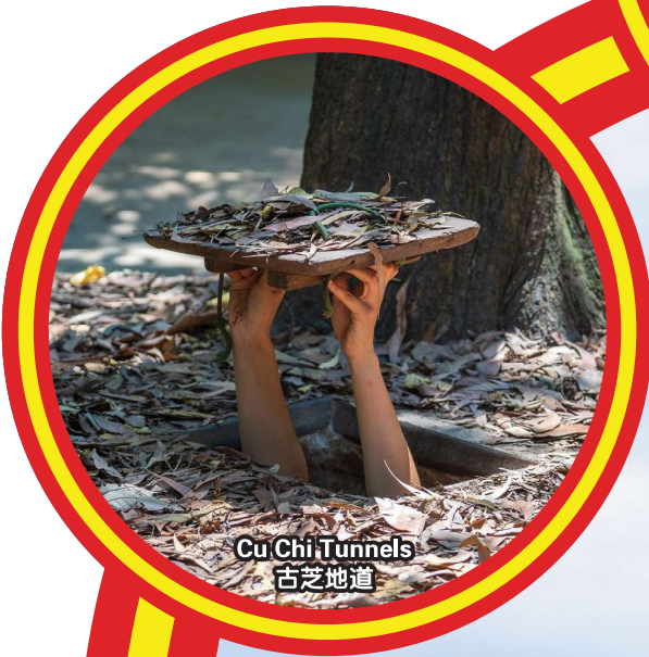
Cu Chi Tunnels 古芝地道