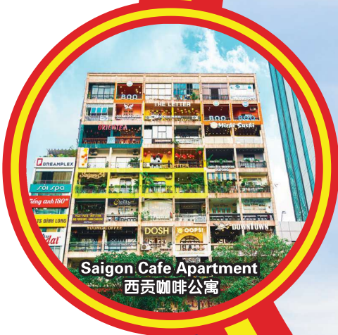
Saigon Cafe Apartment 西贡咖啡公寓