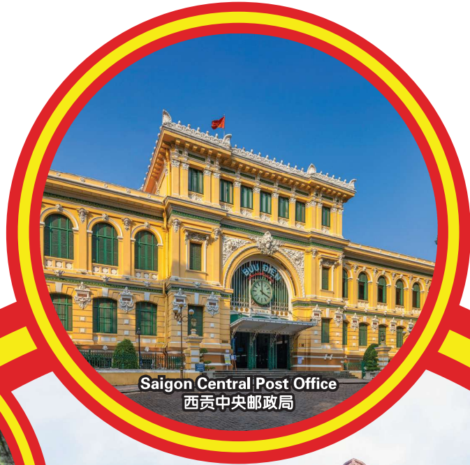
Saigon Central Post Office 西贡中央邮政局