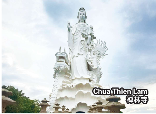
Chua Thien Lam 禅林寺