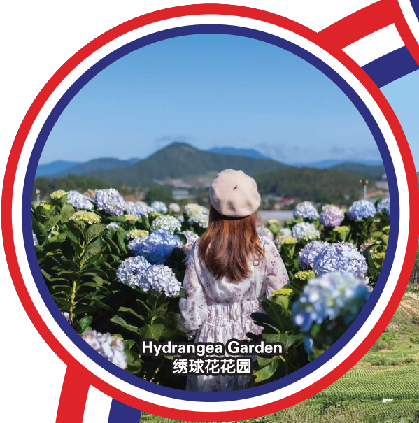
Hydrangea Garden 绣球花花园