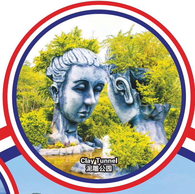
Clay Tunnel 泥雕公园