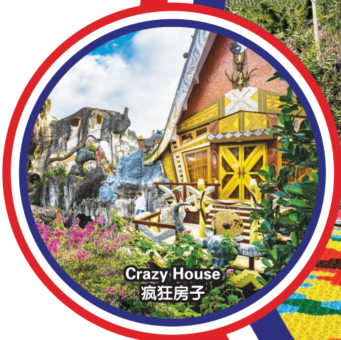
Crazy House 疯狂房子