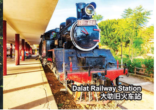
Dalat Railway Station 大叻旧火车站