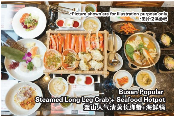
Busan Popular Steamed Long Leg Crab + Seafood Hotpot 釜山人气清蒸长脚蟹+海鲜锅