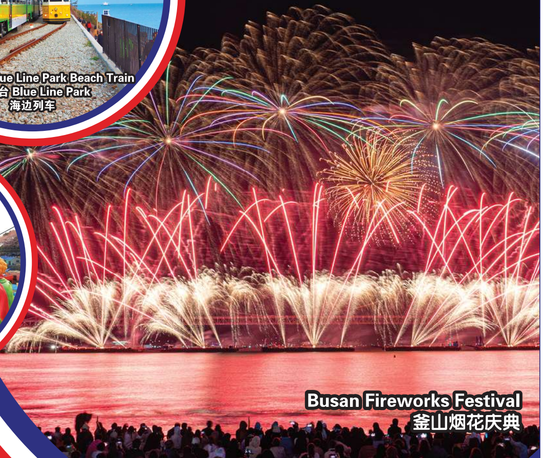
Busan Fireworks Festival 釜山烟花庆典

行程次序，以当地旅社安排为准。 Sequences of Itinerary are subject to local arrangement.