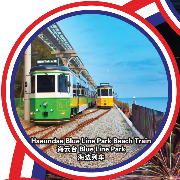
Haeundae Blue Line Park Beach Train 海云台 Blue Line Park 海边列车