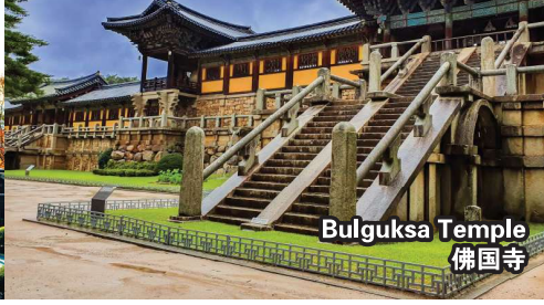
Bulguksa Temple 佛国寺