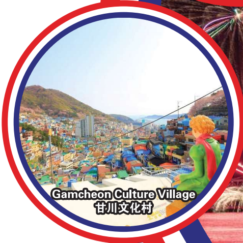
Gamcheon Culture Village 甘川文化村