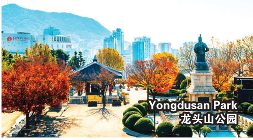
Yongdusan Park 龙头山公园