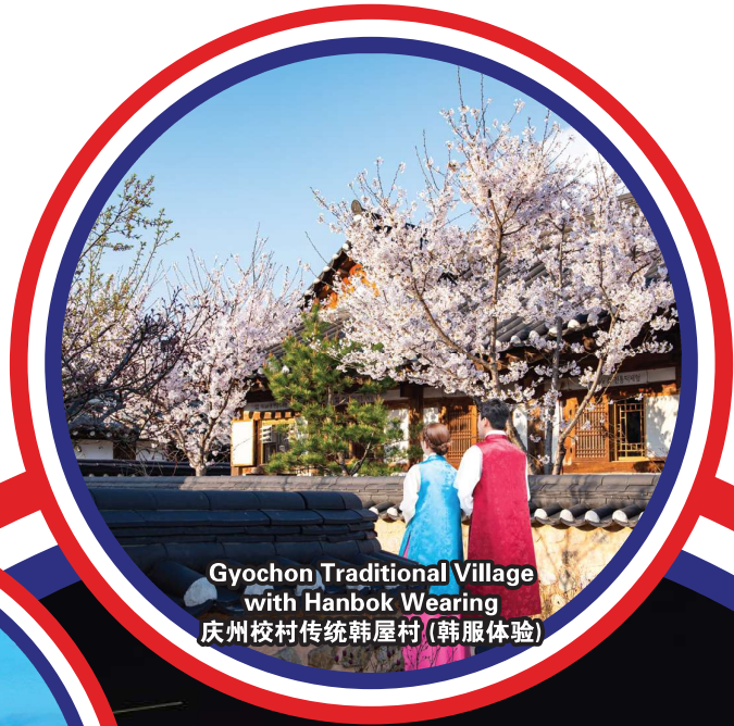
Gyocheon Traditional Village with Hanbok Wearing 庆州校村传统韩屋村 (韩服体验)