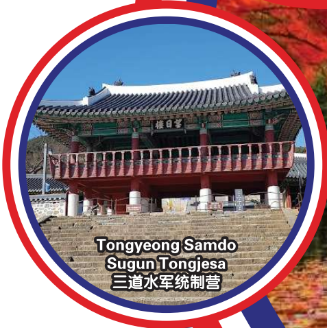
Tongyeong Samdo Sugun Tongjesa 三道水军统制营