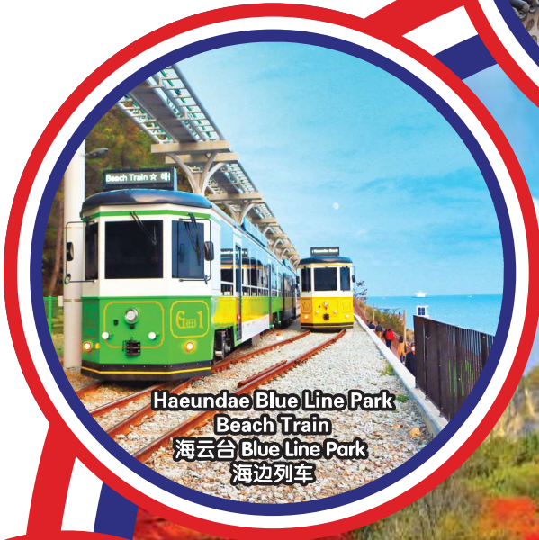
Haeundae Blue Line Park Beach Train 海云台 Blue Line Park 海边列车