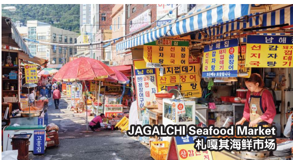
JAGALCHI Seafood Market 札嘎其海鲜市场