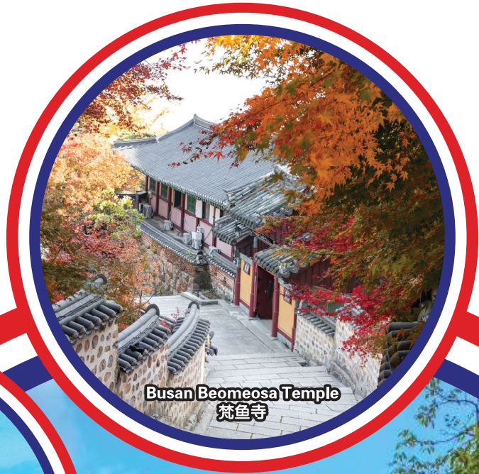
Busan Beomeosa Temple 菴鱼寺