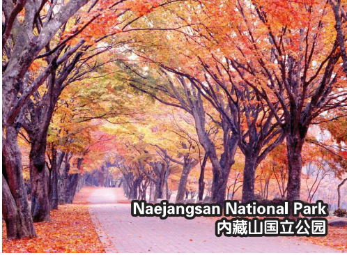
Naejangsan National Park 内藏山国立公园