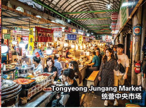
Tongyeong Jungang Market 统营中央市场