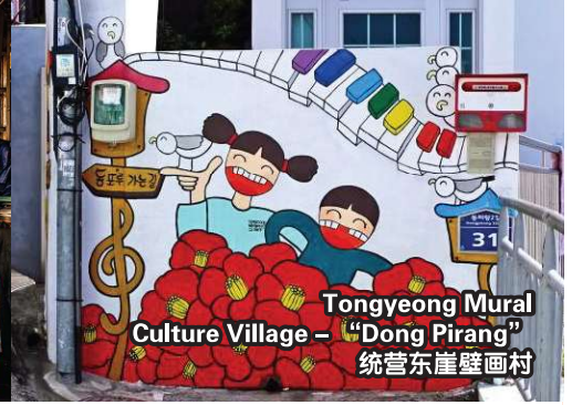
Tongyeong Mural Culture Village - "Dong Pirang" 统营东崖壁画村