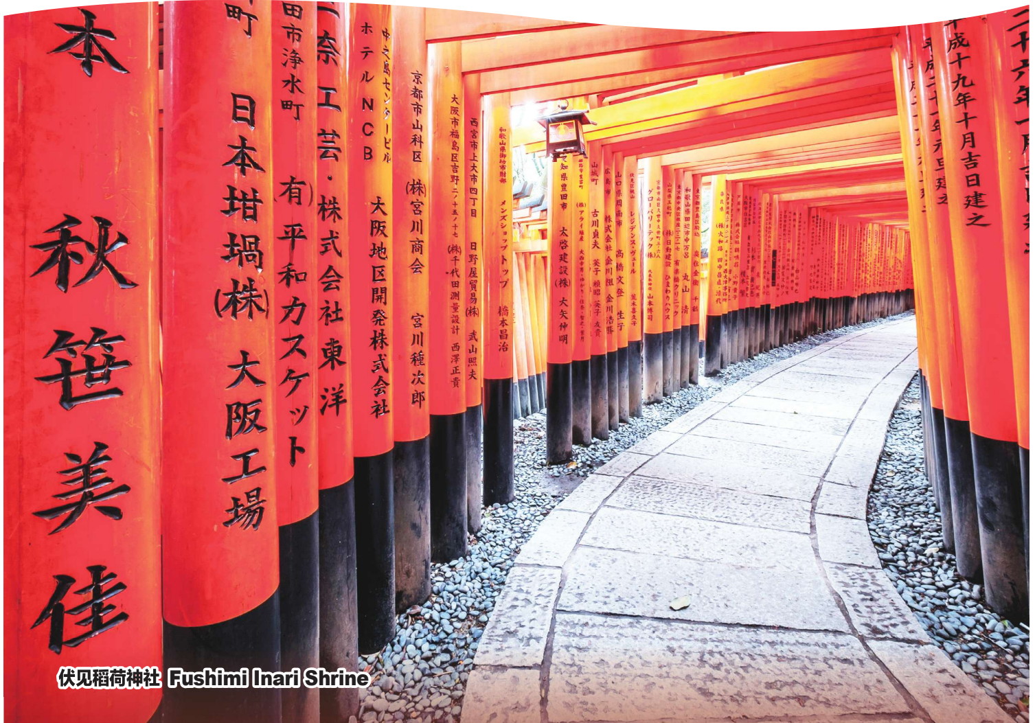
伏见稻荷神社 Fushimi Inari Shrine