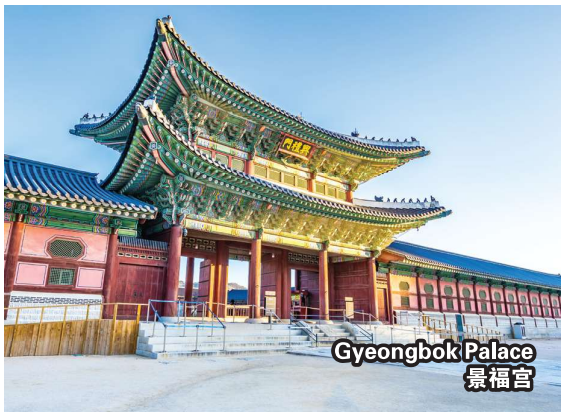
Gyeongbok Palace 景福宫

免责声明: 必要时黄金旅程保留对行程进行适当调整 (调整景点游览顺序) 以确保行程顺利进行, 会或否事先通知。 备注: 如果旅游行程受到上述问题的影响, 将不予退款或更换。图片仅供参考。