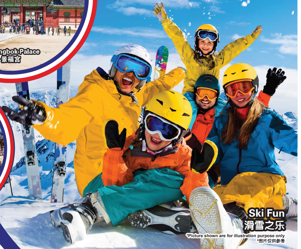
Ski Fun 滑雪之乐

行程次序，以当地旅社安排为准。 Sequences of Itinerary are subject to local arrangement.