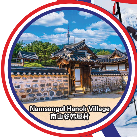
Namsangol Hanok Village 南山谷韩屋村