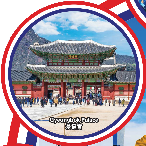
Gyeongbok Palace 景福宫