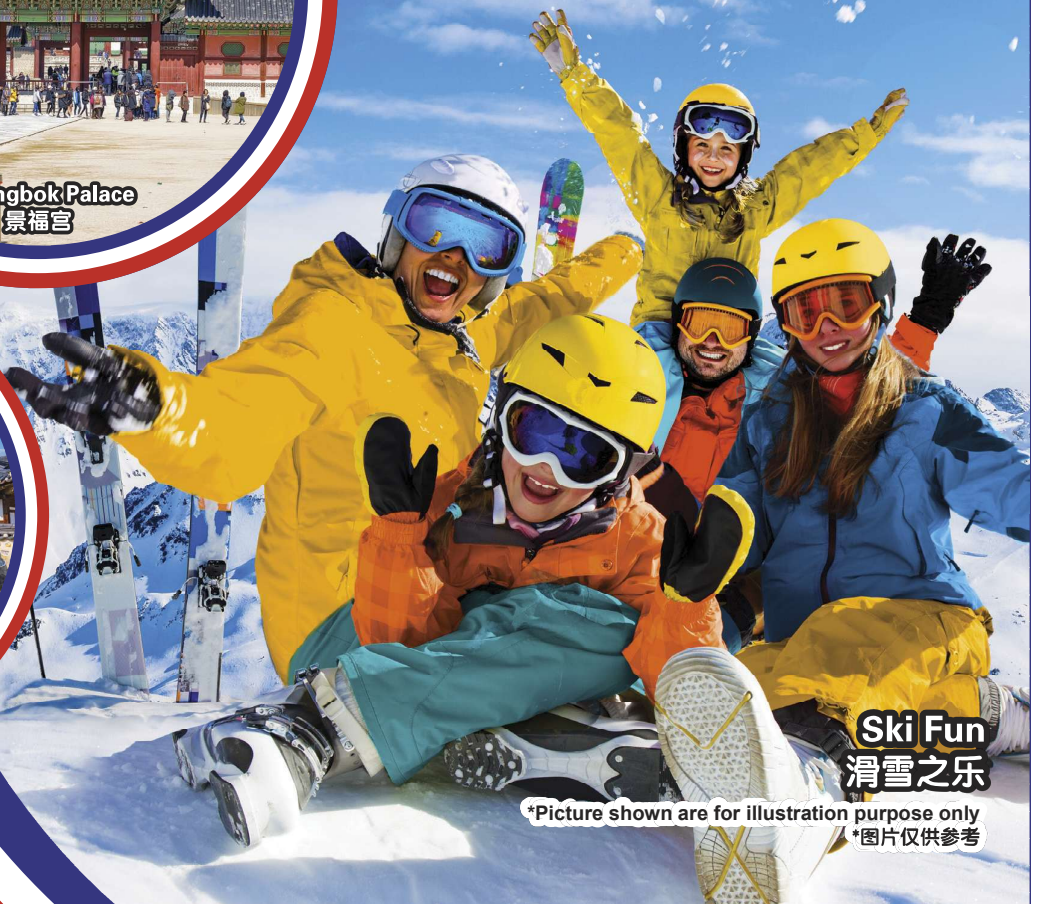
Ski Fun 滑雪之乐

行程次序，以当地旅社安排为准。 Sequences of Itinerary are subject to local arrangement.