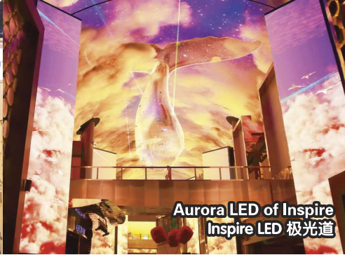
Aurora LED of Inspire Inspire LED 极光道