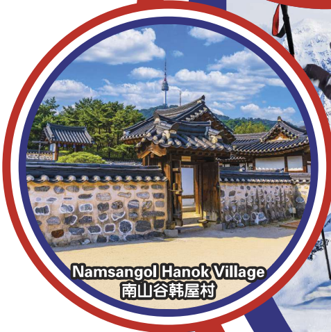
Namsangol Hanok Village 南山谷韩屋村