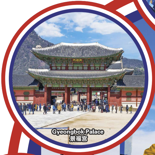
Gyeongbok Palace 景福宫