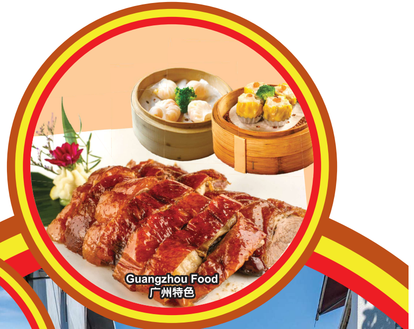
Guangzhou Food 广州特色