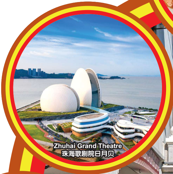
Zhuhai Grand Theatre 珠海歌剧院日月贝