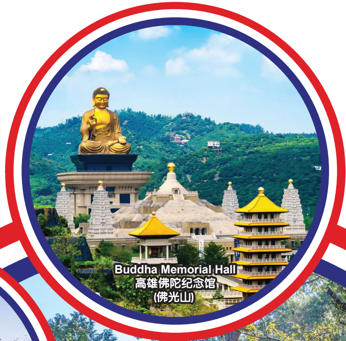
Buddha Memorial Hall 高雄佛陀纪念馆 (佛光山)