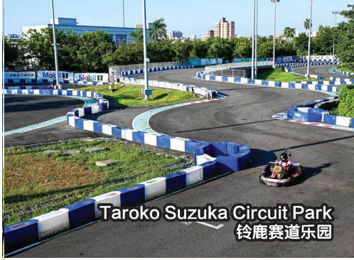
Taroko Suzuka Circuit Park 铃鹿赛道乐园