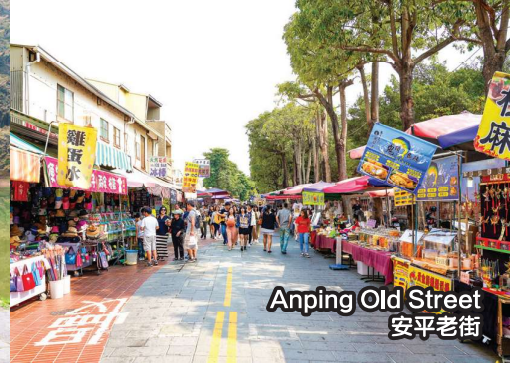
Anping Old Street 安平老街