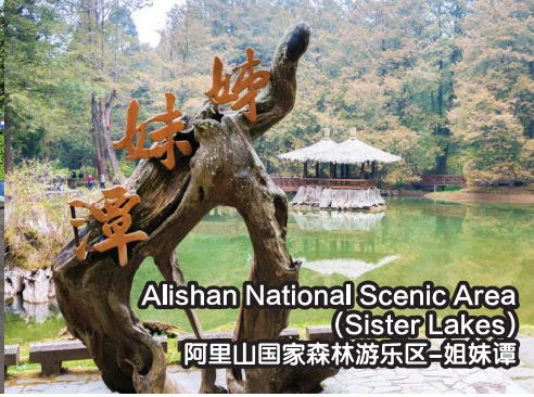
Alishan National Scenic Area (Sister Lakes) 阿里山国家森林游乐区-姐妹潭