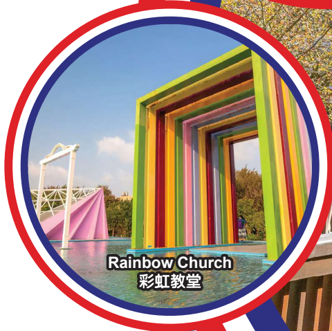
Rainbow Church 彩虹教堂