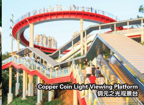
Copper Coin Light Viewing Platform 铜元之光观景台