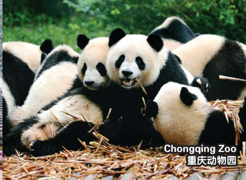
Chongqing Zoo 重庆动物园