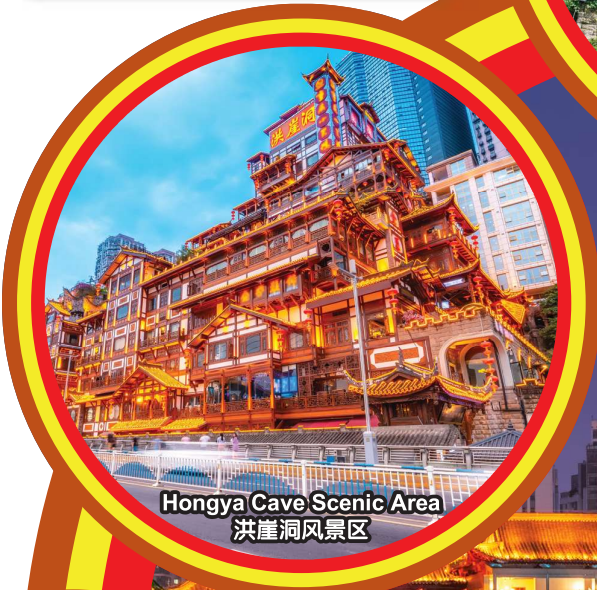
Hongya Cave Scenic Area 洪崖洞风景区