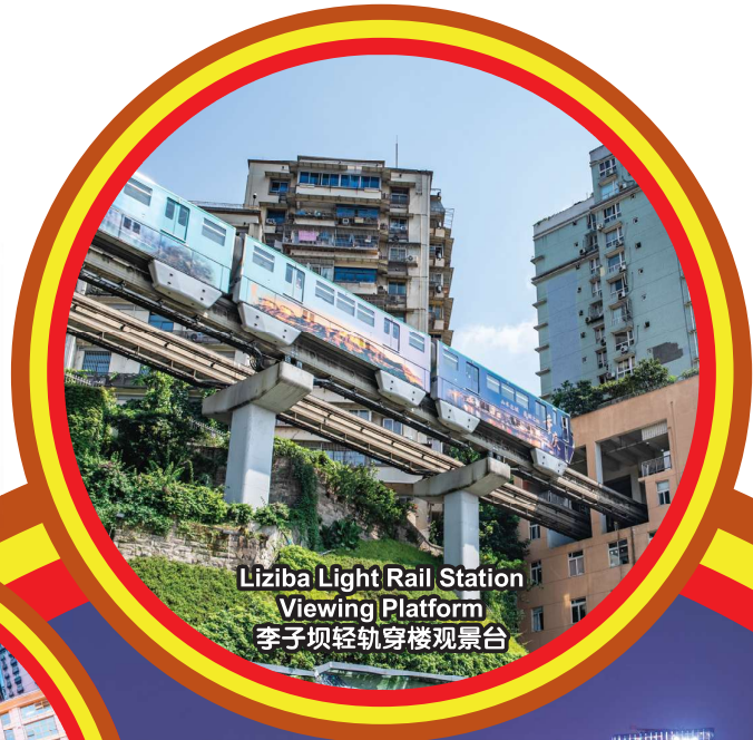
Liziba Light Rail Station Viewing Platform 李子坝轻轨穿楼观景台