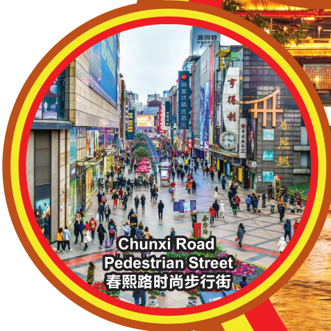
Chunxi Road Pedestrian Street 春熙路时尚步行街