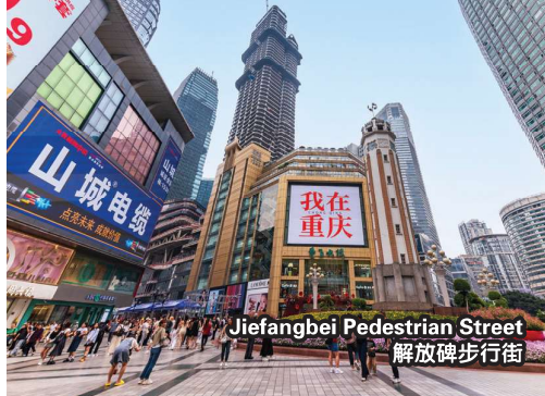
Jiefangbei Pedestrian Street 解放碑步行街