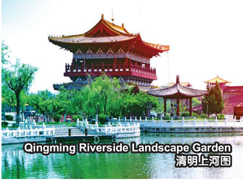
Qingming Riverside Landscape Garden 清明上河园