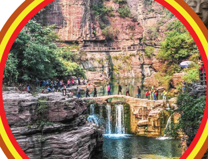
Yuntai Mountain 云台山