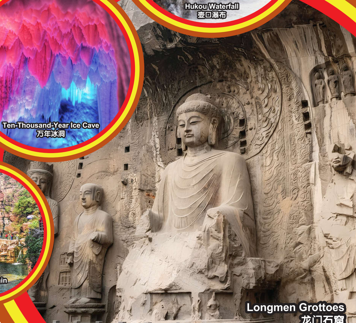
Longmen Grottoes 龙门石窟

行程次序, 以当地旅社安排为准。 Sequences of Itinerary are subject to local arrangement.