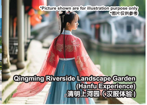
Qingming Riverside Landscape Garden (Hanfu Experience) 清明上河园(汉服体验)

*Picture shown are for illustration purpose only *图片仅供参考