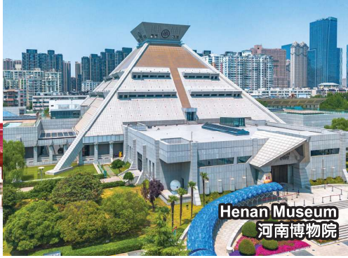
Henan Museum 河南博物院