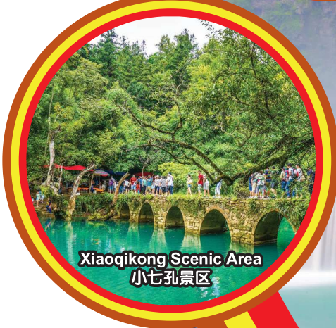
Xiaoqikong Scenic Area 小七孔景区