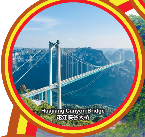
Huijiang Canyon Bridge 花江峡谷大桥