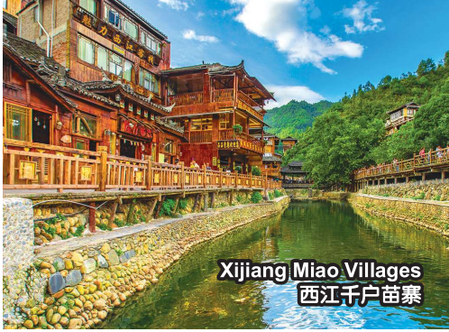
Xijiang Miao Villages 西江千户苗寨