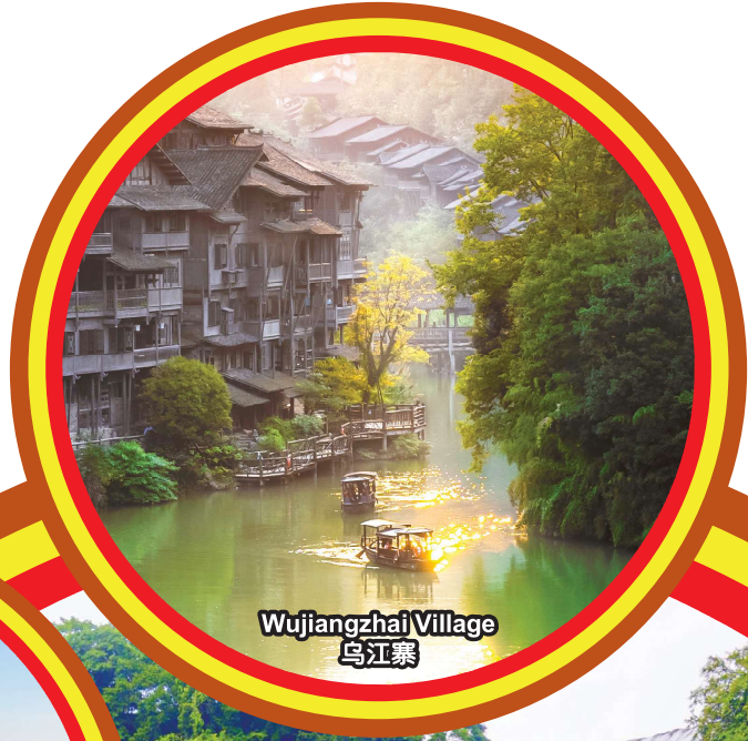
Wujiangzhai Village 乌江寨