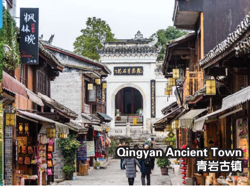
Qingyan Ancient Town 青岩古镇