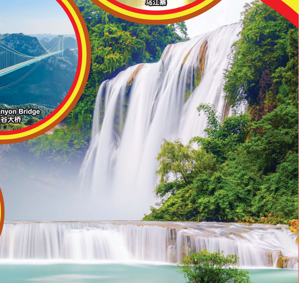
Huangguoshu Waterfall 黄果树大瀑布