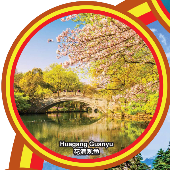
Huagang Guanyu 花港观鱼