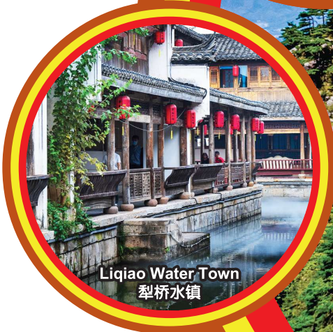
Liqiao Water Town 梨桥水镇