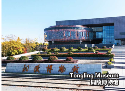
Tongling Museum 铜陵博物馆