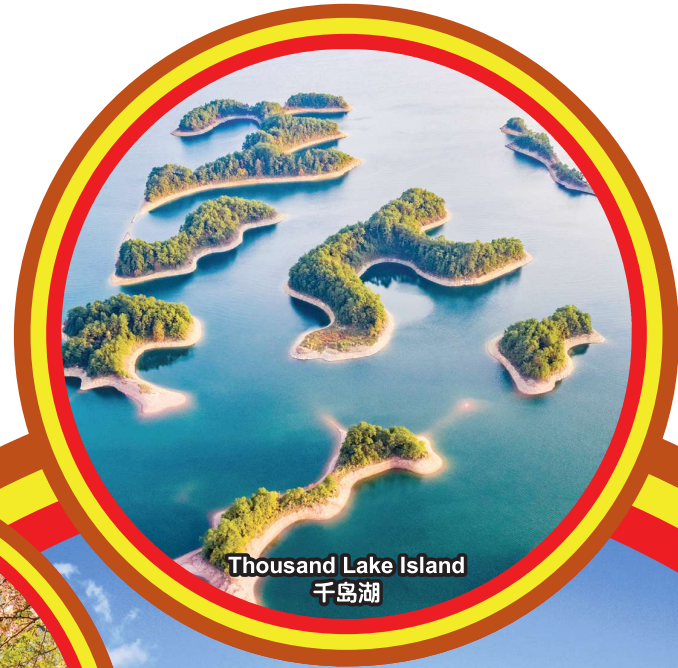
Thousand Lake Island 千岛湖