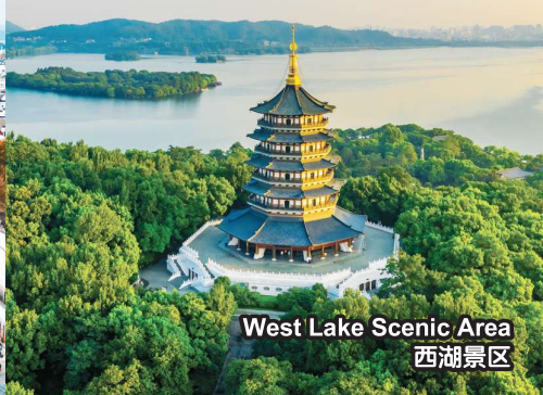
West Lake Scenic Area 西湖景区