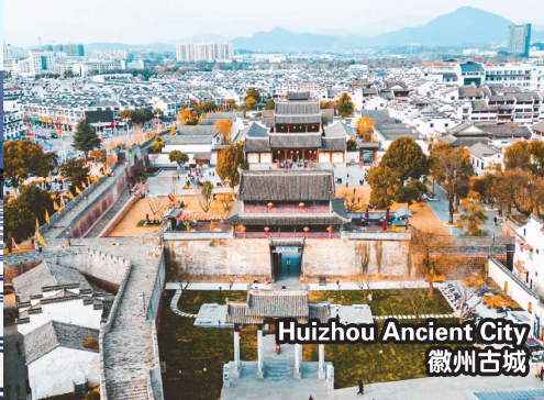
Huizhou Ancient City 徽州古城