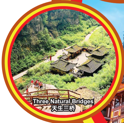
Three Natural Bridges 天生三桥