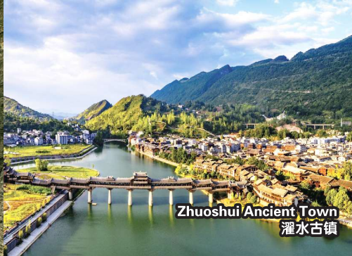
Zhuoshui Ancient Town 濯水古镇