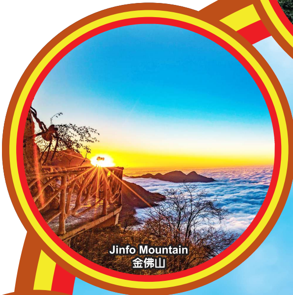
Jinfo Mountain 金佛山