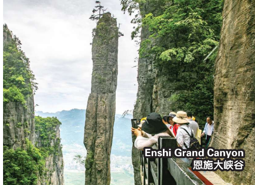
Enshi Grand Canyon 恩施大峡谷