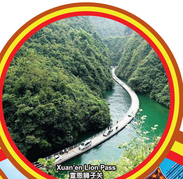
Xuan'en Lion Pass 宣恩狮子关