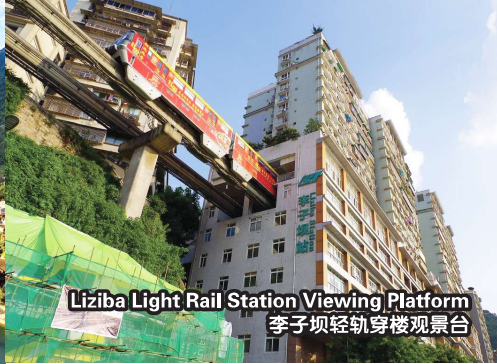
Liziba Light Rail Station Viewing Platform 李子坝轻轨穿楼观景台