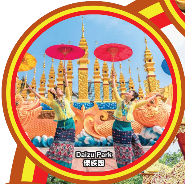
Daizu Park 傣族园