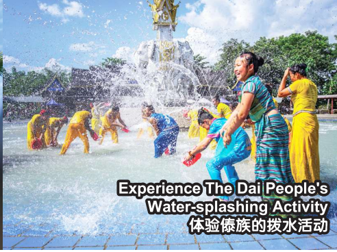
Experience The Dai People's Water-splashing Activity 体验傣族的泼水活动