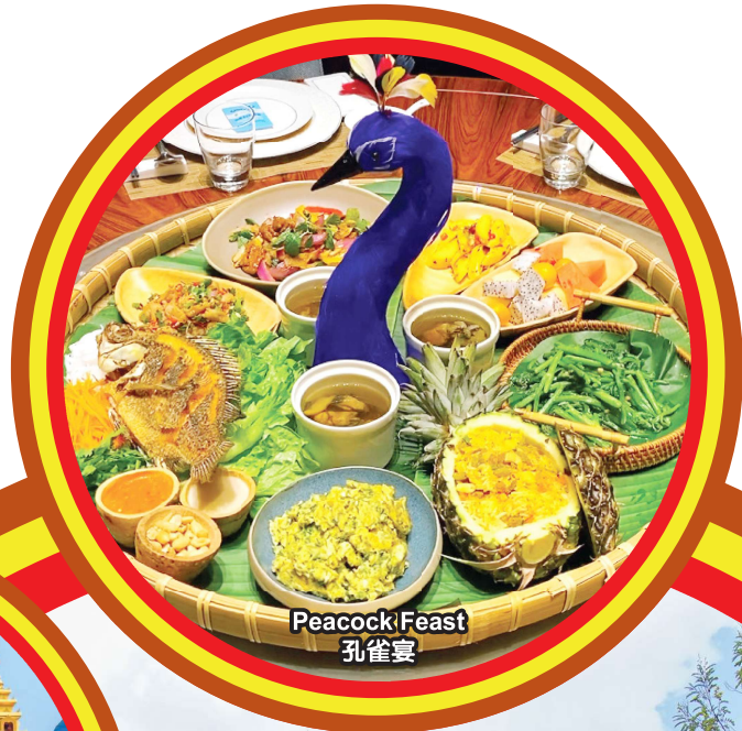
Peacock Feast 孔雀宴