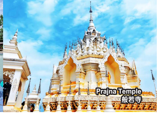
Prajna Temple 般若寺